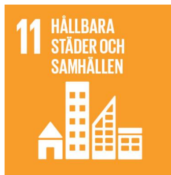
Figur 1. Trygghet - en nödvändighet för hållbara städer och samhällen (UNDP, 2021).

Att identifiera hur den nya typen av styrning ser ut från statlig, regional och kommunal nivå, i relation till andra involverade planeringsaktörer, är därför av intresse för att hitta lösningar på hur olika samhällsutmaningar ska kunna lösas. Enligt UN Habitat (u.å) är samhällsplanering det mest lämpliga verktyget i det trygghetsskapande arbetet. Trygghetsaspekten är idag även en viktig hållbarhetsfaktor, vilket gör den intressant att undersöka ur ett planeringsperspektiv på olika nivåer, samt hur denna nya typ av planering kan verka för en ökad trygghet.