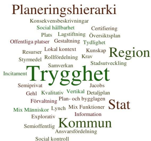
Figur 2. Överblick över studiens centrala begrepp (Egen illustration)