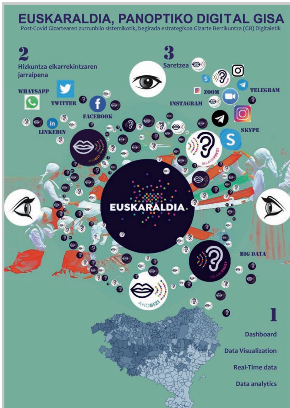
Irudia 2. Euskaraldia, Panoptiko Digital Gisa

(iii) Azkenik, iharduera bereziak, alegia, ekitaldiak egin litezke lekuan-lekuko partehartze online-a bideratuz ( Telegram edota Instagram -en bidez). Guzti hau zentralizatu eta uneoro komunikatu beharko litzateke Euskaraldiak irauten duen bitartean, interaktibitate eta biralitate gorena erdietsiz.