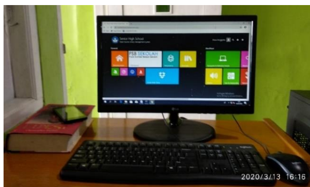
Gambar 7. SchILS pada Komputer Perpustakaan SMK Bina Pangudi Luhur

Keistimewaan SchILS adalah ketersediaan koleksi digital Buku Sekolah Elektronik (BSE) dan Buku Cerita Rakyat terbitan Kemdikbud yang sudah dipaketkan dalam SchILS. Dengan demikian dalam satu kali instalasi, perpustakaan sekolah sudah memperoleh sistem otomasi perpustakaan beserta koleksi digital didalamnya. Hampir semua ruang lingkup kegiatan perpustakaan dapat diotomasikan dengan SchILS, antara lain pengadaan, inventarisasi, katalogisasi, sirkulasi bahan pustaka, pengelola anggota, laporan stistik, dan lain sebagainya. Sejauh ini sudah ada 150 data judul koleksi yang tersimpan dalam SchILS Perpustakaan SMK Bina Pangudi Luhur. Jumlah tersebut merupakan gabungan dari jenis koleksi tercetak dan digital. Data koleksi ini membantu temu kembali pencarian koleksi dan otomatis tersambung dengan data sirkulasi apabila ada pengguna yang melakukan transaksi peminjaman atau pengembalian koleksi, lihat Gambar 7.