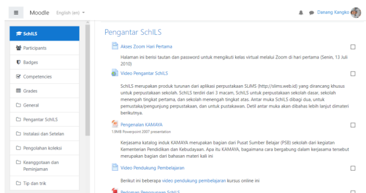
Gambar 3. Modul pelatihan daring via https://schils.gnomio.com

Kegiatan kedua pada tahap pelaksanaan adalah pelatihan daring. Pelatihan daring terkait teori pengelolaan perpustakaan berbasis sistem otomasi perpustakaan dilakukan selama lima hari. Pelatihan yang berlangsung pada 13-17 Juli 2020 ini menggunakan metode campuran asinkronus dan sinkronus. Pelaksanaan metode asinkronus dilakukan melalui https://schils.gnomio.com dan Grup WhatsApp . Pelaksanaan metode sinkronus dilakukan menggunakan media Zoom Video Communications . Pelatihan ini dilakukan secara team-teaching bersama dengan tim pengabdian, lihat Gambar 3.