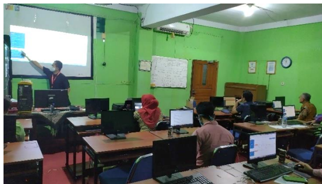
Gambar 4. Pelaksanaan pelatihan luring

berlangsung pada Kamis, 16 Juli 2020 sejak pukul 09.00-15.00 WIB di SMK Bina Pangudi Luhur. Acara ini dilakukan dengan menerapkan protokol kesehatan terkait dengan Pembatasan Sosial Berskala Besar Transisi (PSBB Transisi) yang diterapkan di DKI Jakarta karena pandemi Covid19, lihat Gambar 4.