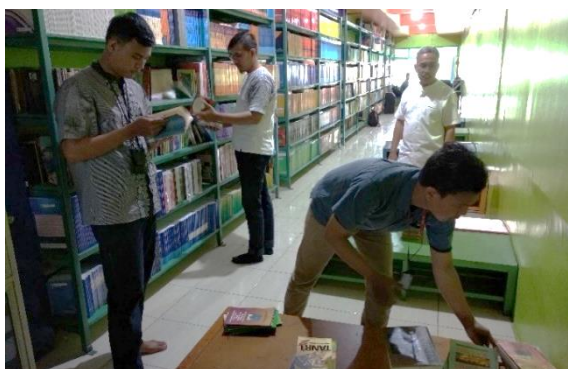
Gambar 6. Pemilihan koleksi untuk Entri Data

Kegiatan keempat pada tahap pelaksanaan adalah entri data koleksi dan data pengguna perpustakaan. Koleksi yang ada di Perpustakaan SMK Bina Pangudi Luhur perlu diseleksi sebelum didata pada SchILS. Hal ini dilakukan karena sebagian besar koleksi perpustakaan tersebut tidak memenuhi kebutuhan pengguna perpustakaan. Banyak koleksi perpustakaan yang sudah rusak, usang, dan tidak relevan karena pemanfaatan perpustakaan yang disalah-artikan sebagai gudang buku. Tim pengabdian menyeleksi setidaknya 100 buku untuk didata pada SchILS, lihat Gambar 6. Data anggota perpustakaan diimpor dari data siswa pada sistem akademik sekolah.