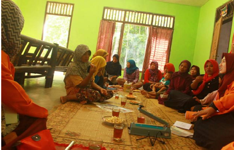
Gambar 5. Pelatihan Kemasan dan labelling

produk sejenis dan meningkatkan nilai jual. Dokumentasi kegiatan tersebut disajikan pada Gambar 5.