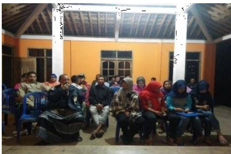
Gambar 1. Sosialisasi Program Pemberdayaan Masyarakat

Sosialisasi program disampaikan kepada warga pada tanggal 30 Juli 2018, di aula Dusun Gedoro. Kegiatan tersebut merupakan rangkaian kegiatan yang pertama kali dilakukan untuk memberikan gambaran program yang akan dijalankan. Dokumentasi pelaksanaan sosialisasi program tersaji pada Gambar 1.