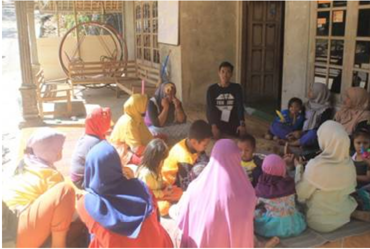
Gambar 2. Pengenalan empon-empon, kandungan zat berkhasiat empon-empon, dan cara budidaya

Empon-empon seperti jahe, kunir, dan temulawak banyak mengandung senyawa antioksidan yang dapat digunakan untuk mengatasi kanker dan penyakit degeneratif sehingga sangat potensial untuk dibuat menjadi minuman kesehatan. Untuk mempermudah dalam penggunaan dan menjaga higienitas empon-empon sebagai minuman kesehatan, dapat dibuat dalam bentuk sirup, serbuk instan, atau fresh drink. Hal ini belum banyak diketahui oleh para ibu rumah tangga Dusun Gedoro sehingga perlu dilakukan penyuluhan tentang cara membuat minuman kesehatan dari empon-empon. Dokumentasi pelaksanaan penyuluhan dapat dilihat pada Gambar 3.