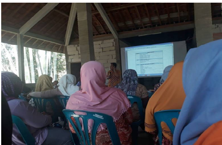
Gambar 3. Penyuluhan tentang Cara Membuat Minuman Kesehatan dari Empon-Empon

Empon-empon seperti jahe, kunir, dan temulawak banyak mengandung senyawa antioksidan yang dapat digunakan untuk mengatasi kanker dan penyakit degeneratif sehingga sangat potensial untuk dibuat menjadi minuman kesehatan. Untuk mempermudah dalam penggunaan dan menjaga higienitas empon-empon sebagai minuman kesehatan, dapat dibuat dalam bentuk sirup, serbuk instan, atau fresh drink. Hal ini belum banyak diketahui oleh para ibu rumah tangga Dusun Gedoro sehingga perlu dilakukan penyuluhan tentang cara membuat minuman kesehatan dari empon-empon. Dokumentasi pelaksanaan penyuluhan dapat dilihat pada Gambar 3.