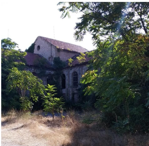
Ilustración 1: Parte de la fachada de la Azucarera Labradora.

A pesar de que han pasado muchos años, el edificio, formado por una nave central y dos laterales perpendiculares a estas, se ha conservado hasta la actualidad, aunque no en las mejores condiciones, es decir, haría falta rehabilitarlo para que pudiera ser funcional [2]. El edificio se construyó en piedra combinada con ladrillo en diferentes zonas como las pilastras y el borde de las ventanas, las cuales en la actualidad están tapiadas en su mayoría. La fábrica cuenta con un gran número de vanos, debido a su utilidad a la hora de aportar luminosidad y ventilación [3]. En cuanto a la superficie, el edificio cuenta con 4.300 m 2 , además de una parcela anexa de 30.000 [4].