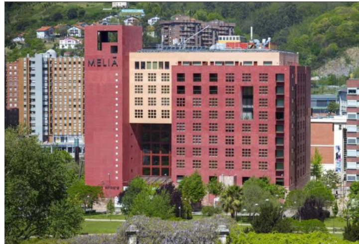
Ilustración 3: Hotel Meliá Bilbao

Para su rehabilitación se tuvieron en cuenta los criterios de sostenibilidad en el diseño y construcción de hoteles, además se adhirió al Proyecto SAVE: ahorro y eficiencia energética e hídrica y finalmente utiliza un sistema con el que se mide anualmente la huella de carbono por estancia con el fin de contribuir a la sostenibilidad del edificio [21].