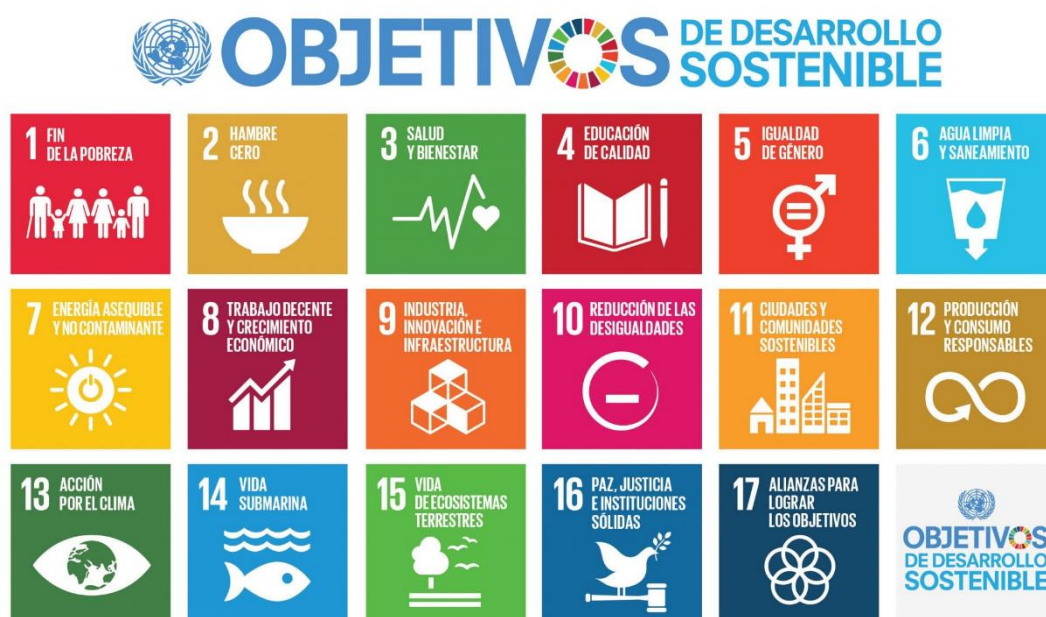
Ilustración 4: ODS

Como hemos explicado anteriormente en el marco teórico, tendremos en cuenta los objetivos de desarrollo sostenible aprobados por la ONU en 2015, utilizándolos como base para un planteamiento sostenible del proyecto, tanto social, económica y medioambientalmente.