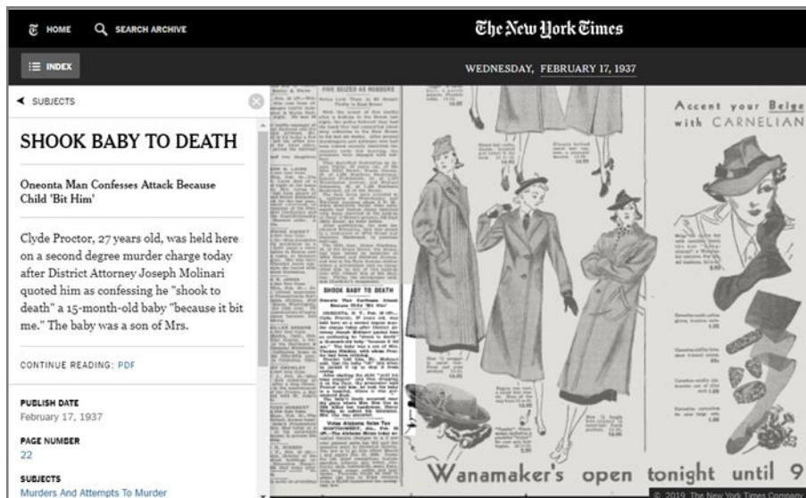
3. ábra Dühében megrázta a rábizott kisfiút