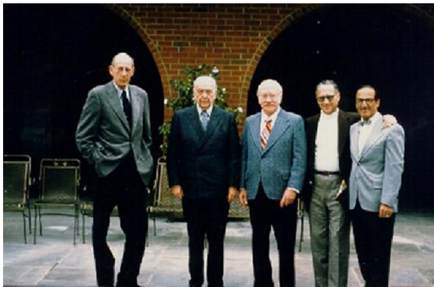
5. ábra , John Caffey (1895-1978) sötét öltönyben

Az 1946-ban megjelent cikkében, mely a hosszú csöves csontok és a subduralis haematomák összefüggéseiről jelent meg, még nagyon óvatosan fogalmaz. A trauma és a nem trauma okozta sérülésekről értekezik 6 olyan gyermek esetét elemezve, akik együtt élnek ezekkel a sérülésekkel, de a gondozók, szülők tagadták a bántalmazás tényét (az esetek felében nem volt meg a trauma története!). Ennek okaként azt feltételezte a szülők tartanak attól, hogy szándékos gondatlansággal vádolják őket. A sérülések elemzésekor megállapította, hogy azok különböző időpontokban keletkeztek, és nem talált csontbetegségekre utaló tüneteket sem. Így elfogadta, hogy ha minden egyéb okot kizár, akkor a sérüléseket szándékos vagy véletlen trauma okozta. A hosszú csöves csontok törése és az egyéb sérülések ok-okozati kapcsolatát leírta. Bár az egyik csecsemőnél felvetődött a gyermekbántalmazás, a szándékos rossz bánásmód lehetősége (a háttér dokumentációból kiderült, hogy egyik szülő sem akarta a gyermeket), de a bizonyítékok nem voltak elégségesek sem ahhoz, hogy megerősítsék a bántalmazás tényét, sem ahhoz, hogy azt teljes bizonyossággal kizárják. Minderre csak 1962-ben került sor, amikor is Henry Kempe és munkatársai leírták a "megvert gyermek szindrómát". 21 Későbbi munkájában felhívja a figyelmet arra is, hogy a gyermeknek nemcsak egy szülő okozhat sérüléseket, hanem a vizsgálódást ki kell terjeszteni a gyermek szélesebb környezetére is (nagynénik, unokatestvérek, testvérek, babysitter, stb.).