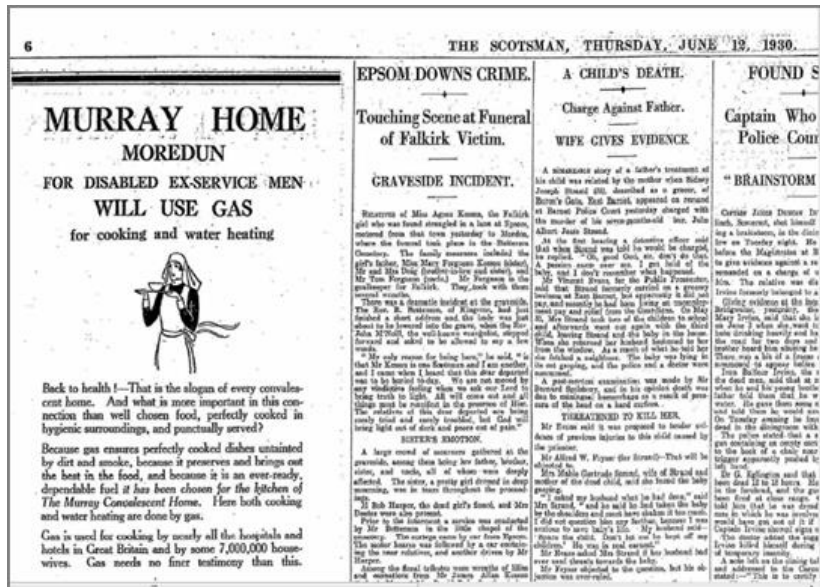
2. ábra Az apa tettéért 5 év börtönt kapott

Amerikai Egyesült Államok, New York Times 1937 16