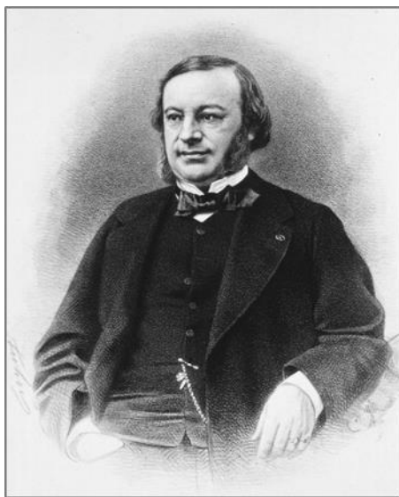
1. ábra Ambroise Tardieu (1818-1879)

Igazságügyi szakértőként több mint, 5000 esetben működött közre. Ezek között volt számos híres és hírhedt bűncselekmény is (pl. Françoise Choiseul-Praslin hercegnő esete, akit férje gyilkolt meg, majd a férj öngyilkosságot követett el. Az eset közvetlenül hozzájárult az 1848-as francia forradalomhoz). A „Kriminalisztikai és klinikai vizsgálat a mérgezésről” című műve elnyerte a Francia Tudományos Akadémia díját és évtizedekig alapműnek számított. 6