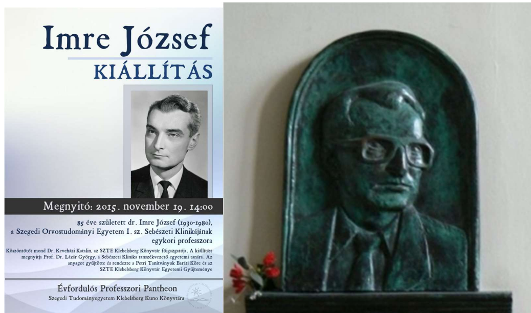
4. ábra kiállítás és szobor Imre Józsefről