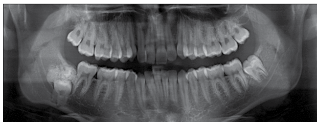
2. kép: Fogszabályozó kezelés előtt készült panorámaröntgenfelvétel (2016)