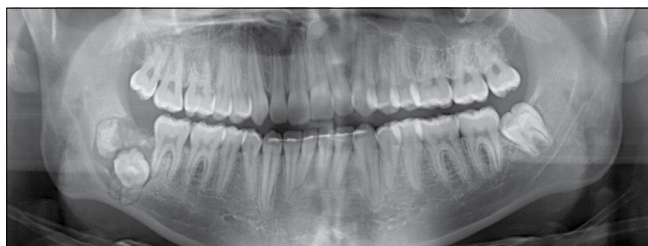
1. kép: Kiindulási panorámaröntgenfelvétel (2019)

A kezelés első lépése az akut odontogén gyulladás és a következményes szájzár megszüntetését célozta