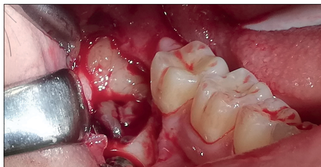
4. kép: A bölcsességfog eltávolítása után a defektus feltöltése platelet-rich fibrinnel (2. műtét)

A három hónapos kontroll során készített panoráma-röntgen-felvételen a műtési terület csontos telődése látható, a jobb alsó második őrlő distalis gyökerénél a pe-