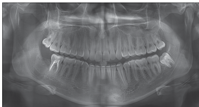
5. kép: Kontroll panoráma-röntgen-felvétel három hónappal a második műtét után

riapicalis rajzolat egészséges szerkezetű, egészen a fognyaki régióig követhető (5. kép).