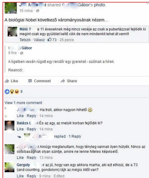
Trollkodás (Facebook, 2016. július)