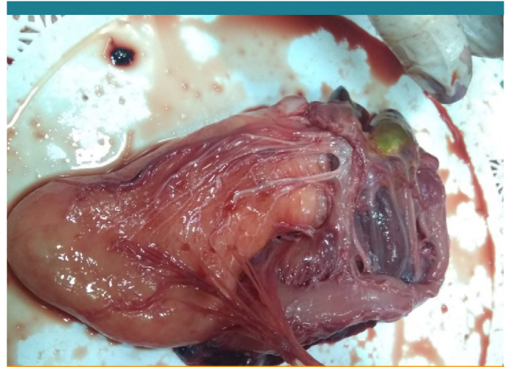
Se ajustarán técnicas simples que requieran instalaciones de poca complejidad.

La Dra. Leiva reiteró que "la idea es desarrollar procesos simples, para que tanto el proceso de extracto de enzimas como su degradación para obtener otros productos derivados lo puedan realizar los mismos pobladores".