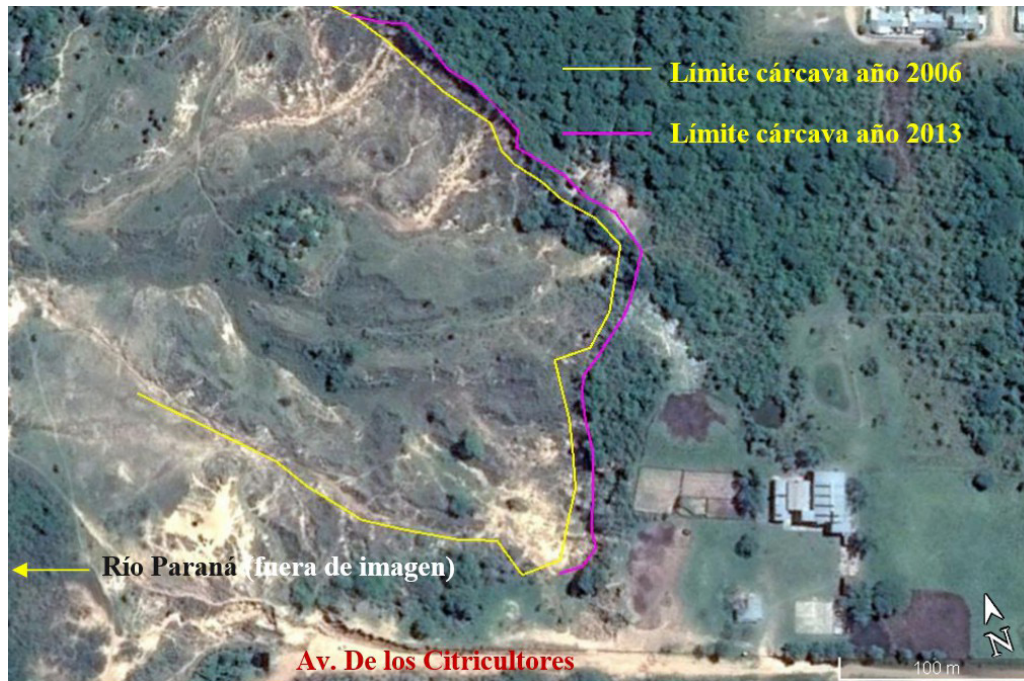
Figura 4. Vista aérea de cárcava y delimitación.

Se comparó expeditivamente el retroceso que experimenta la cárcava situada en la intersección de la Av. De los Citricultores con el río Paraná (Figura 4), la comparación se hizo analizando dos imágenes de Google Earth de los años 2006 y 2013, la cárcava analizada corresponde al sector de desagüe pluvial de la zona sur de la localidad. En la Figura 4 puede verse que este retroceso está entre los 6 y 10m.