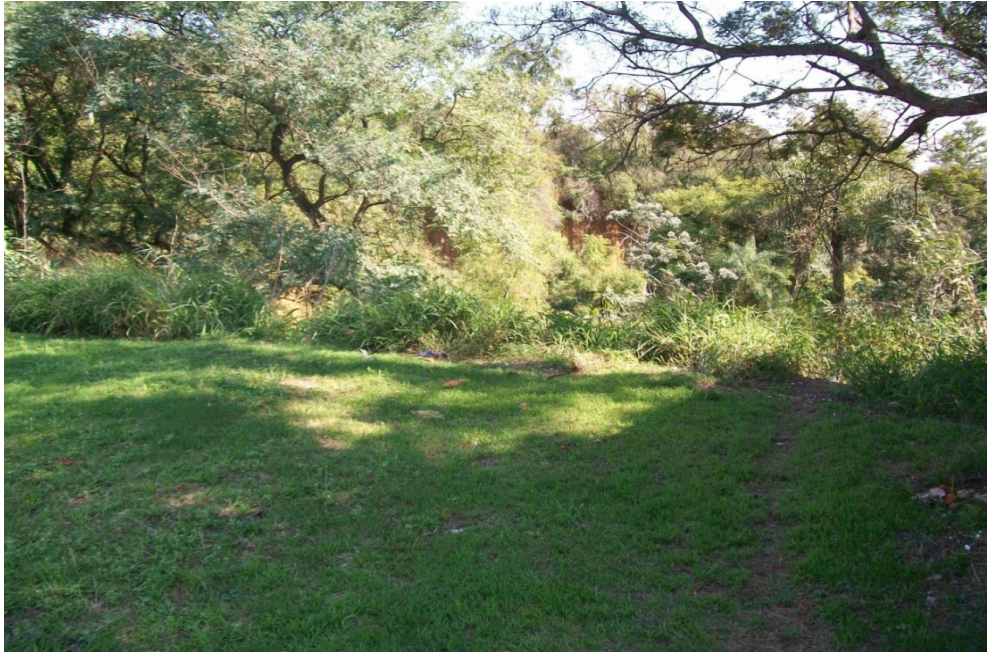
Figura 5. Aspecto y vegetación de la cárcava existente.