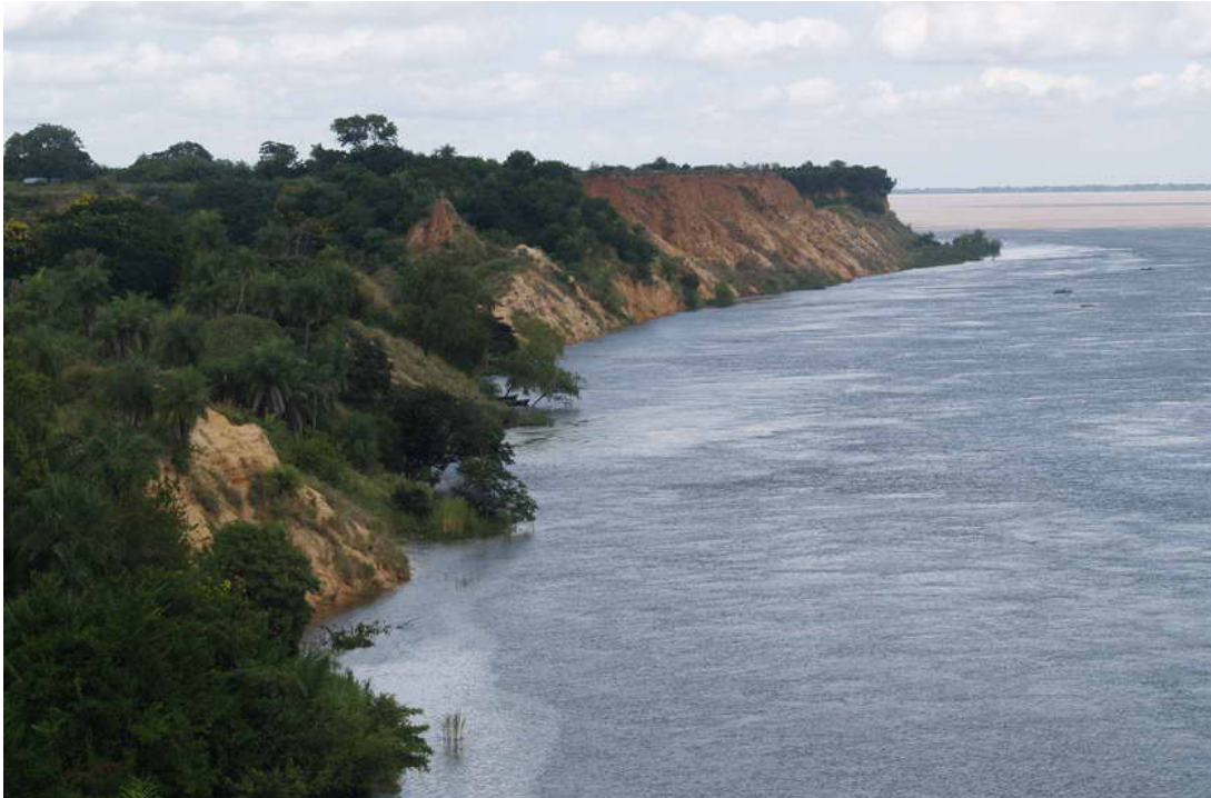
Figura 3. Imagen de barrancos en Bella Vista.

La erosión de barrancos sobre el río Paraná (Figura 3) se evidencia principalmente desde la localidad de Empedrado hasta Lavalle, en el gran paisaje de la planicie aluvial del Paraná y sus afluentes.