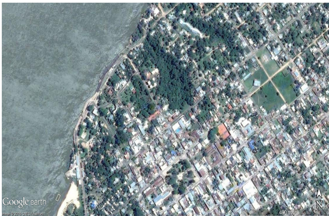
Figura 2. Ubicación de cárcava en la localidad de Bella Vista.

Las cárcavas existentes (Figura 2) en pleno centro de la localidad, constituyen un problema, no solo por la pérdida de espacio e inconvenientes que ocasionan a los conductos de desagües que en ellas descargan, sino también porque a la vez se transforman en áreas receptoras de todo tipo de descarga y su avance paulatino va comprometiendo la estabilidad de las estructuras cercanas a ellas. La cárcava que se indica, activa y controlada mediante medidas de atenuación ejecutadas en las inmediaciones, que consisten entre otras en un empastado desmalezado periódicamente; las especies que se utilizan tienen una cobertura densa, preferiblemente de tipo rizomatosa; evitando aquellas de tipo cespitosas o que constituyan matas aisladas. Se emplean también cortinas vegetales también como una estrategia recomendada, en razón que el viento suele provocar voladuras, que luego provocan correderas del agua; como precaución adicional es preciso que en el área de influencia de la cárcava no existan prácticas culturales (explotaciones agrícolas y/o desagües) que provocan eventuales correderas o incrementan los volúmenes de descarga en la cárcava.