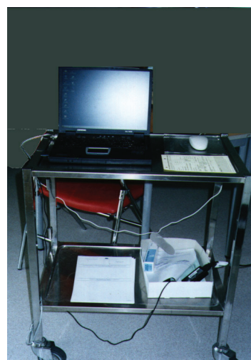
Figura 1 - Carrinho dos médicos com computador portátil em 2003.

A aplicação do software de prescrição médica supõe também a articulação de outras aplicações informáticas relativas aos serviços administrativos que se referem ao doente, às autorizações dadas aos pessoais, à atribuição dos identificadores e senhas, à base de dados dos medicamentos, às incompatibilidades medicamentosas, à gestão de estoque da farmácia etc. Ela supõe também que médicos e enfermeiras sejam capacitados para usar o software e que um suporte técnico esteja à disposição dos usuários no caso de pane ou dificuldade.