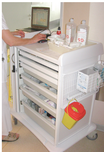
Figura 3 - Carrinho dos medicamentos com computador portátil em 2008.

Quando da observação em 2003, o instrumento era utilizado de forma intensa e sistemática, confirmando assim a sua reputação de unidade de tratamento aberta às novas tecnologias. Os médicos realizavam suas prescrições e as alteravam em função da evolução do paciente. As enfermeiras consultavam e imprimiam os tratamentos médicos e os PAM, em seguida validavam estes após ter administrado os medicamentos. O chefe de unidade interessou-se pela prescrição informatizada por muito tempo e contribuiu para o seu desenvolvimento. A unidade já tinha sido o lugar de teste, em 1996, de um software de prescrição medicamentosa. Assim, o novo software, mais eficiente, foi adotado mais facilmente uma vez que o pessoal já tinha experiência, mas, também porque havia permitido restabelecer a “paz social” entre os médicos e enfermeiras ao suprimir antigos conflitos ligados à prescrição oral. Os médicos diziam que podiam acompanhar facilmente os tratamentos prescritos e ser auxiliados pelo computador. Além disso, a divulgação da ferramenta no hospital foi acompanhada de uma série de ações como campanhas de sensibilização dos médicos e dos enfermeiros para que participassem do controle da conformidade das prescrições realizadas pelos médicos.