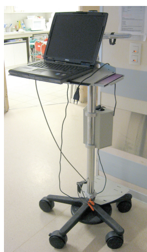
Figura 2 - Carrinho dos médicos com computador portátil em 2008.