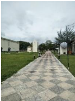
Gambar 2. Jalur Pejalan Kaki

Desain jalur pejalan kaki di dalam kawasan sudah sesuai dengan standar sirkulasi saat bergerak yaitu 1,08 m, sedangkan untuk 2 orang 1,08 \text{ m} \times 2 = 2,16 \text{ m} , sedangkan lebar pedestrian di dalam kawasan sekitar 3 m.