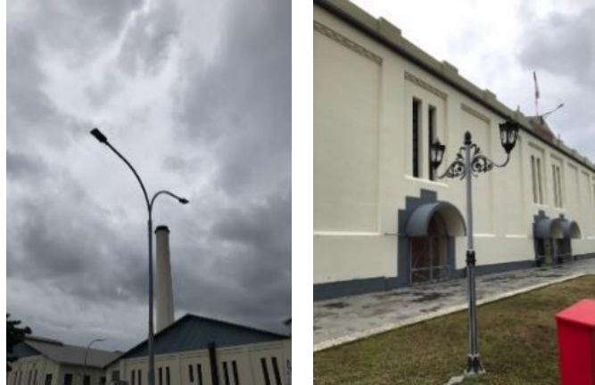
Gambar 4. Lampu

Untuk upaya yang dilakukan dalam mengurangi polusi suara bangunan utama di letakkan jauh dari pintu masuk dan memiliki banyak pepohonan yang bisa meredam suara.