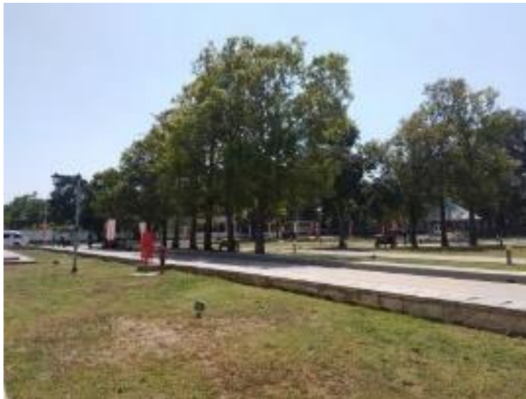
Gambar 1. Ruang Terbuka Hijau

Lahan De Tjolomadoe merupakan lahan bekas pembangunan pabrik gula colomadu pada jaman Belanda. Di dalam kawasan De Tjolomadoe memiliki RTH kurang lebih sebesar 41% dari luas kawasan De Tjolomadoe. Pada kawasan terdapat 20% pohon besar dan 30% pepohonan lokal, hal ini juga sebagai bentuk dari upaya peningkatan iklim mikro. Namun, untuk tanaman sayur dan buah lokal belum tersedia pada kawasan ini.