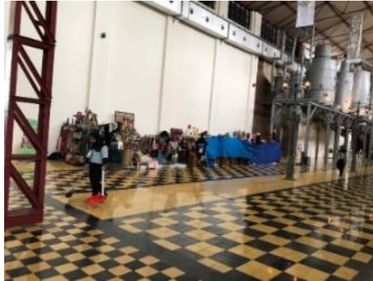
Gambar 3. Sarana Perdagangan

masyarakat setempat. Pengelola De Tjolomadoe juga menyediakan fasilitas untuk masyarakat setempat yang digunakan sebagai kegiatan sosial ekonomi.