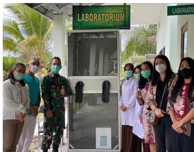
Kegiatan penyerahan bilik swab di depan laboratorium RS TNI-AD Palangka Raya