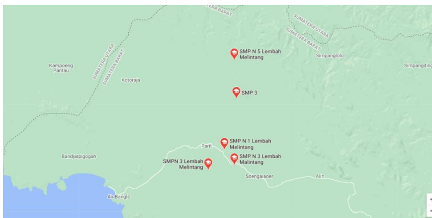
Gambar 1. Lokasi penelitian (google map)

Penelitian ini dilakukan di SMP Negeri 3 Lembah Melintang Pasaman Barat, tempat ini dipilih karena sekolah ini telah menunjukkan hasil kerja pembelajaran PAI sebagai basic membangun disiplin masyarakat sekolah terutama peserta didik. Sebagai gambaran tempat penelitian berikut dapat dilihat pada gambar 1 yang diambil dari google map.