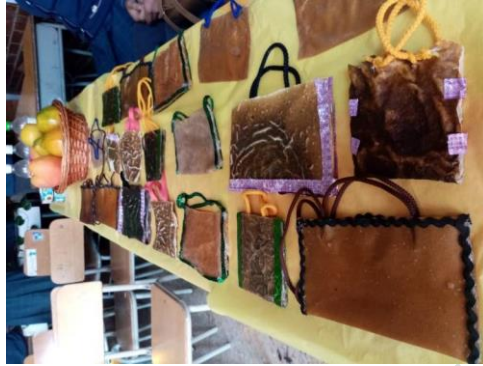
Imagen N°4. Bolsas biodegradables elaboradas por los estudiantes.

de bioplástico de fácil descomposición (ver imagen N° 4), cuyo uso permite el desarrollo de ciudades sostenibles.