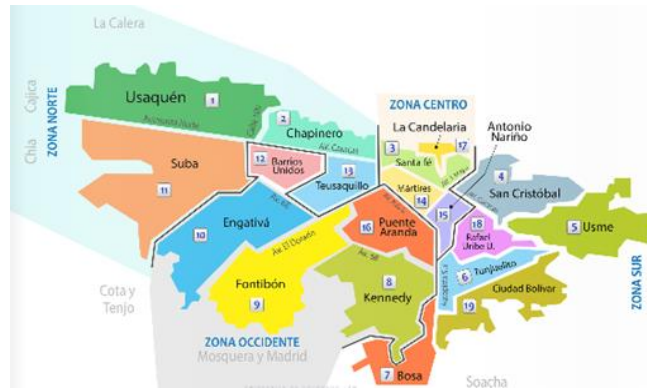
Mapa N° 1. División administrativa de las 20 localidades de la ciudad de Bogotá D.C. (Alcaldía Mayor de Bogotá, s.f.)

La localidad de Suba está en el norte de Bogotá y su característica principal son las zonas verdes, cuerpos hídricos protegidos como los humedales, destacándose los cerros de Suba y La Conejera, sin dejar de lado que, hay una amplia zona residencial, industrias, comercio y servicios recreativos. Se destaca por ser la más poblada con más de un millón de habitantes (Alcaldía Mayor de Bogotá, s.f.).