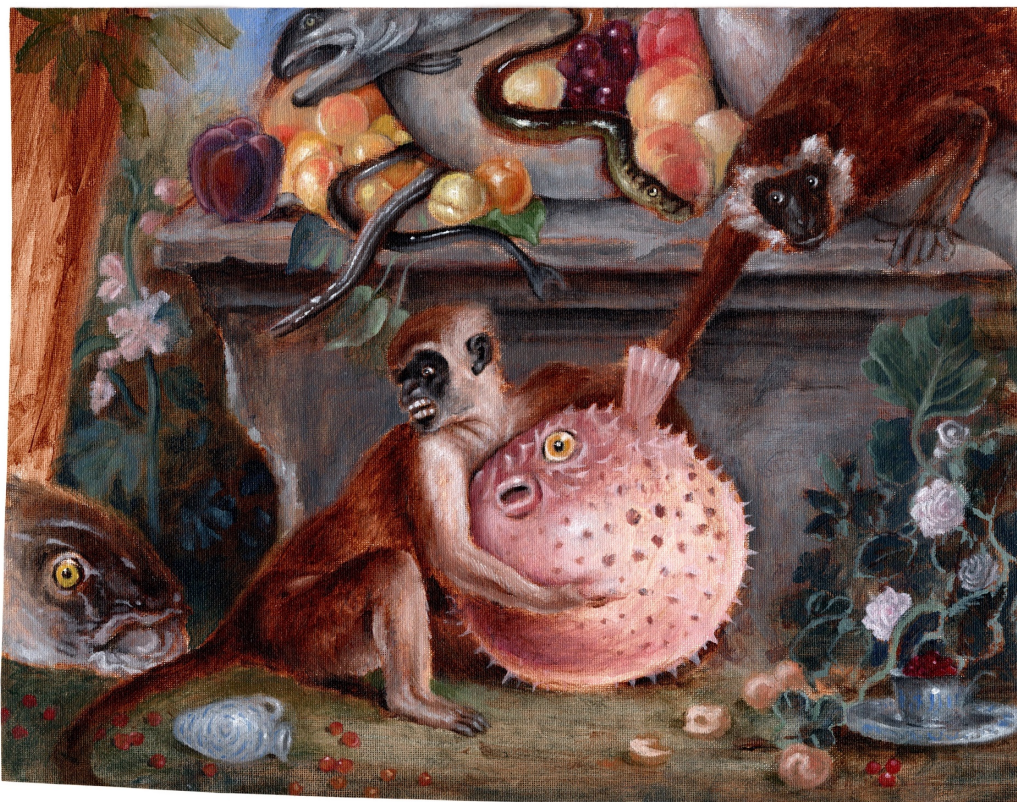
Monkey, Pufferfish, and Peaches , oil on canvas, 2019, © Sam Branton