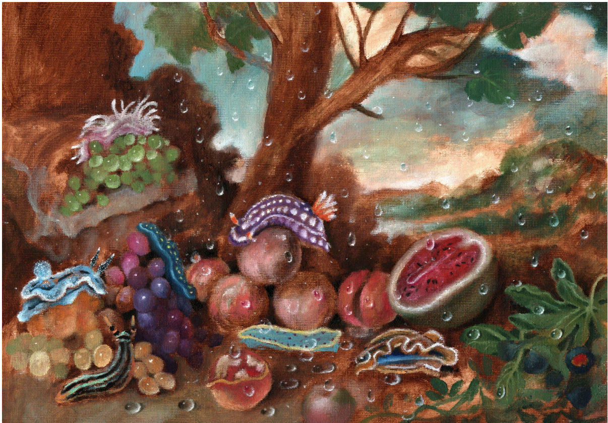
Still Life with Sea Slugs, oil on canvas, 2021