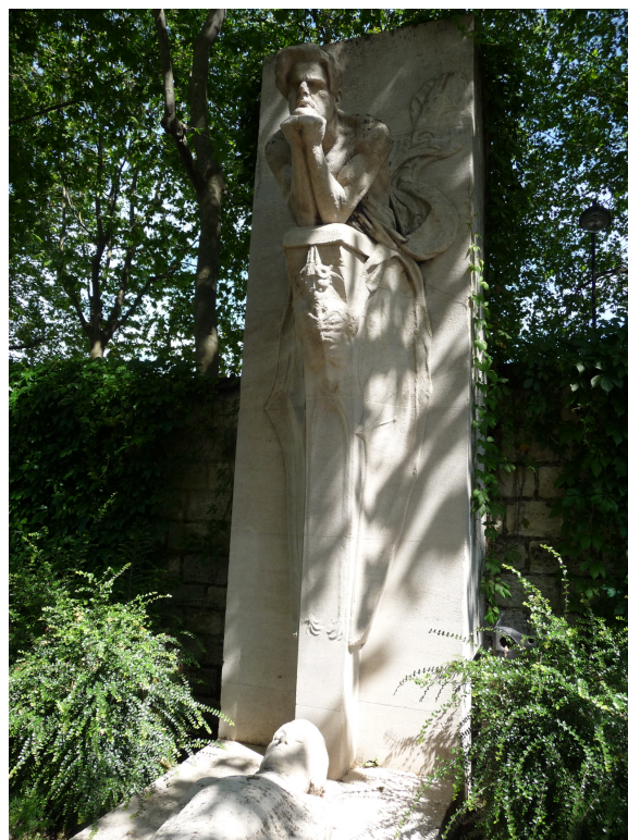
Fig. 2: Baudelaire and 'l'ennui'.