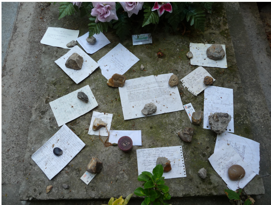
Fig. 1: Tributes to Baudelaire.

I start my introduction with poor Charles' actual burial site: the Aupick family plot near the western wall of the Montparnasse cemetery in Paris. Here, he is reunited with his mother, at least, and this is where poetic pilgrims leave their tributes: selected quotations (the recommendation to be drunk seems to be a perennial favorite, and strikes a chord with students, too), personal testimonials, and assorted objects (flowers, candles, metro tickets). This photo from 2011 shows a sample of the appreciations that are left in many languages.