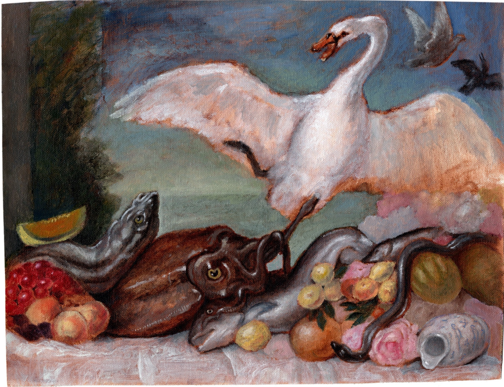
Swan, Squid, and Lemons , oil on canvas, 2019, © Sam Branton