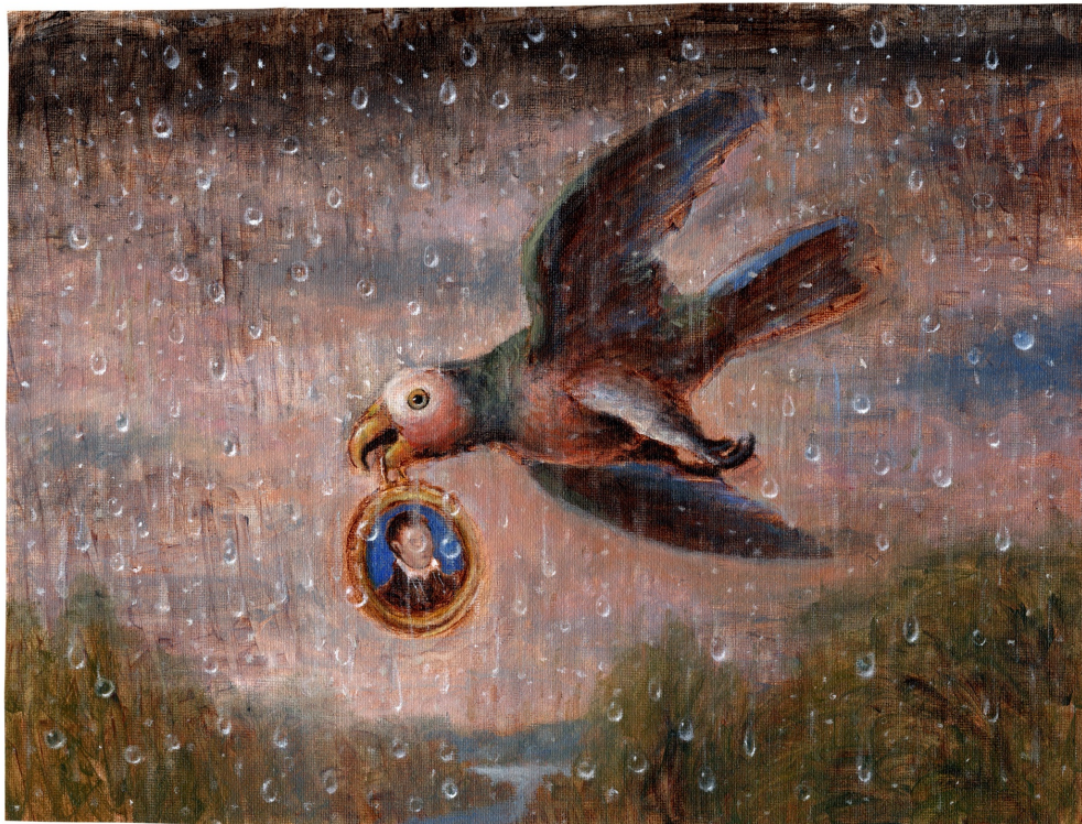
Bird with Miniature , oil on canvas, 2020, © Sam Branton