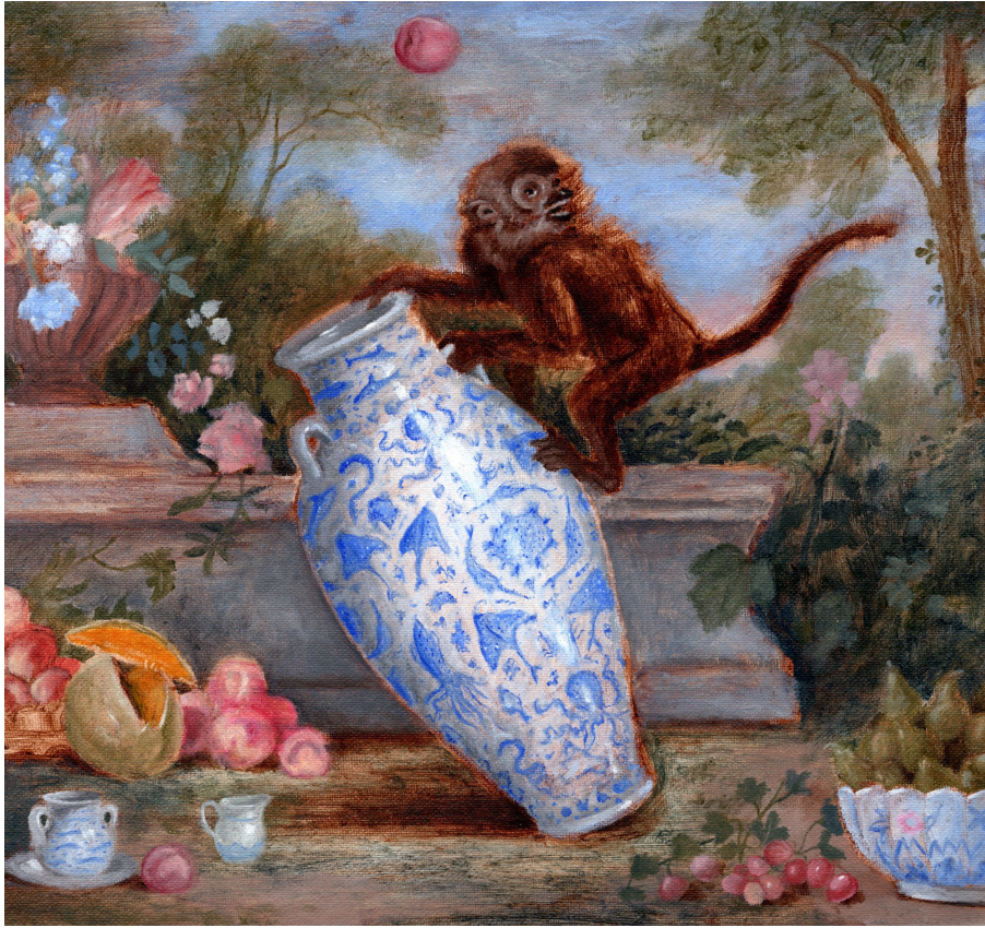
Monkey with Large Vessel , oil on canvas, 2019, © Sam Branton