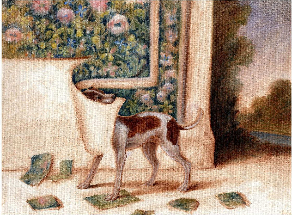
Hound with Tapestry , oil on canvas, 2020, © Sam Branton