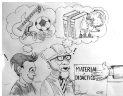
Figura 3. Modelos Mentales

Elaboración Guillermo Arturo Amézquita Vargas