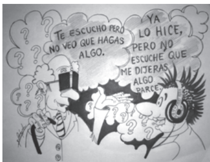
Figura 7. Intersubjetividad Dialógica

Elaboración Guillermo Arturo Amézquita Vargas