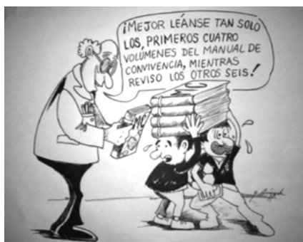
Figura 6. Intersubjetividad Normativa

Elaboración Guillermo Arturo Amézquita Vargas