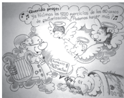
Figura 4. Ideal de Interacción

Elaboración Guillermo Arturo Amézquita Vargas