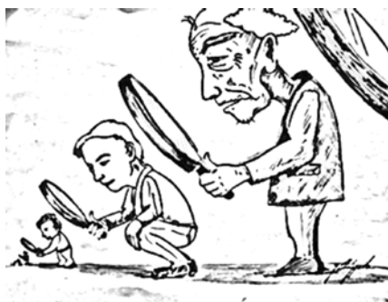
Figura 1. Generaciones 2

Elaboración: Guillermo Arturo Amézquita Vargas.