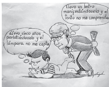
Figura 2. Lenguaje y sus Interpretaciones

Elaboración Guillermo Arturo Amézquita Vargas