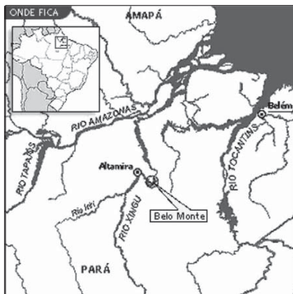
Figura 1. Localização do projeto da Usina Hidrelétrica de Belo Monte.