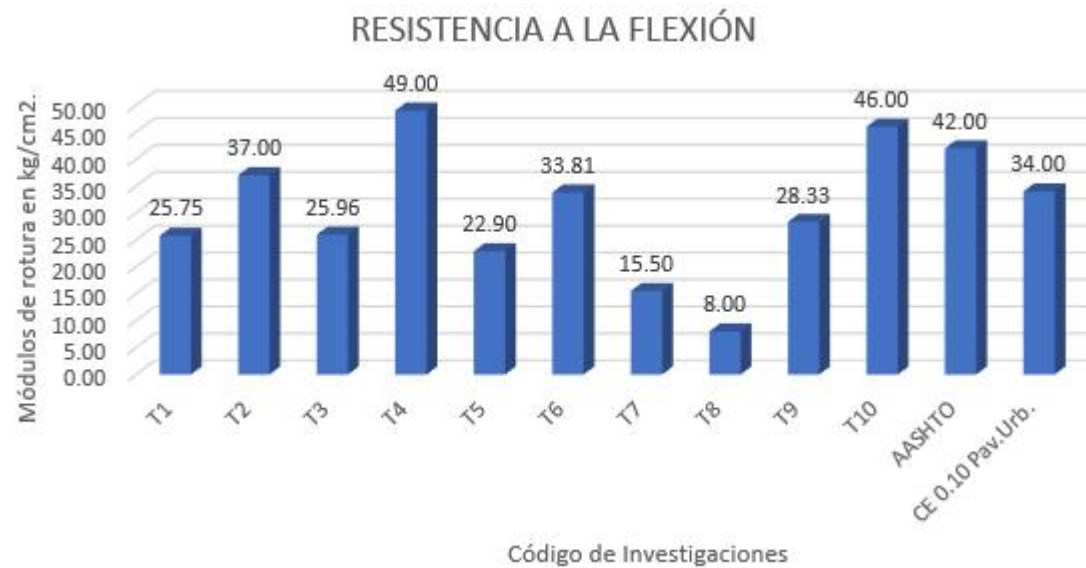
Figura 5. Ensayo de resistencia a la flexión

Solo el 60% realizo este ensayo, el 40% no realizo este ensayo ya que, al hablarse de pavimentos rígidos, para su construcción se usa en algunos casos, dowells, es decir aceros, ya que estos evitan fallas en la estructura.