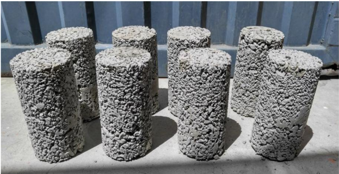
Figura 2. Porosidad del concreto

Otra de las propiedades a evaluar es la porosidad , la cual para Guzmán (2016), mide el vacío o espacios que se da entre agregados, con contenido vacío menor al 15%, no se da percolación significativa sobre el hormigón, se dice que por debajo de dicho porcentaje 15% de huecos, no se logra la interconectividad entre los vacíos que brinde una veloz filtración.