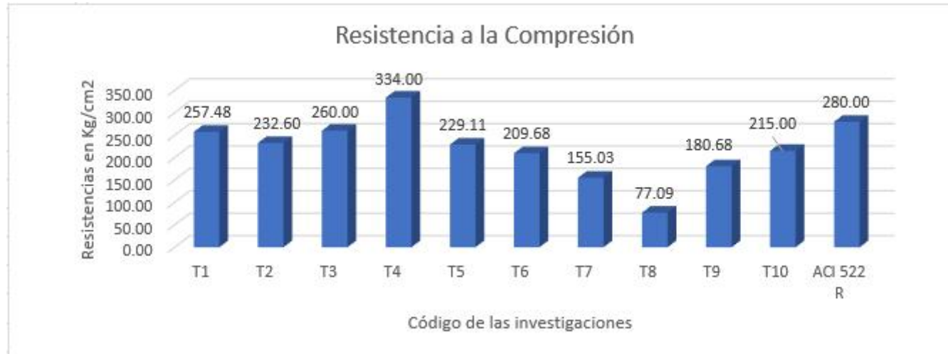
Figura 4. Ensayo de resistencia a la compresión

El 90% realizo este ensayo, para la obtención de estas resistencias en todas las investigaciones, fue necesario añadir agregado fino, pero con un valor de 10% para no perjudicar las propiedades del concreto permeable, como lo es la permeabilidad y la resistencia a la compresión.