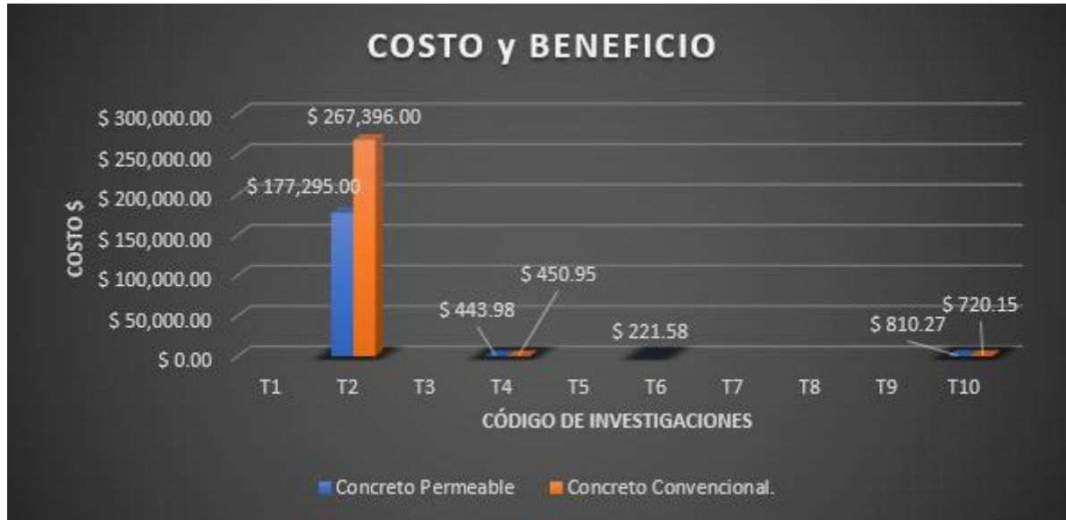
Figura 6. Relación C/B Concreto permeable vs concreto tradicional