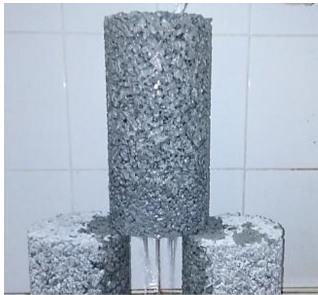
Figura 1. Filtración de agua en la estructura de concreto permeable

El concreto permeable o poroso, a diferencia del concreto convencional resulta de mezclar cemento portland, agregado grueso, agua, aditivos y en casos particulares se usa el agregado fino. Combinados todos estos materiales se genera un material duro y poroso, que varían en tamaños de 2 a 8 mm, que permiten el acceso de agua por sus poros. Para la ACI 522R-10, el contenido de vacíos fluctúa entre 15 a 35%, con resistencia a compresión de 2.8 a 28 MPa. La velocidad de drenar del pavimento de este tipo de concreto esta en función del tamaño de los agregados, densidad de mezcla (p.3).