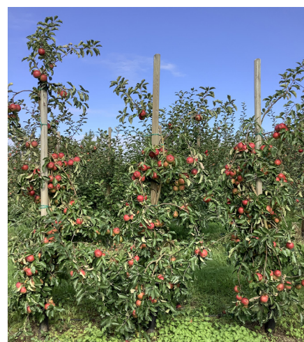
Figur 1. 'Co-op 25' SCARLET O'HARA produktiv och lagringsduglig äppelsort som testats i försöket men som nu alltmer angräps både av skorv och kärnhusröta.

Fruktstorleken anges enligt ECPGR-skala: mycket liten (<61 g), liten (61–80 g),