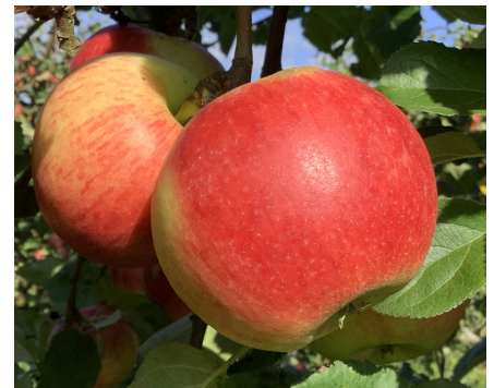
Fig 8 'Saltanat'

valsformig till plattrund, åsig, med medellångt fruktskaft. Gul grundfärg, till betydligt mer än hälften överdragen med en varmt röststrimmig täckfärg. En del rost kan förekomma. Vacker frukt. Något segt skal. Fast och hårt fruktkött, krasigt, saftigt och balanserat sötsyrligt. Tilltalande arom. Behöver ej gallras. Mognadstid: Skördas senare hälften av september. Mycket god lagringsförmåga (4–7 månader). Övrigt: Rekommenderas för utökade odlingsförsök för IP-odling.