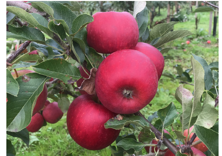
Fig 7 'Rubinstep'

Ursprung: 'Clivia' x 'Rubin', Holovousy, Tjeckien. Träd: Stort friskt träd med ganska bra grenvinklar, kala partier närmast stammen. Medelsen blomning. God motståndskraft mot skorv och mjöldagg. Medelhög avkastning. Frukt: Medelstor frukt (181 g),