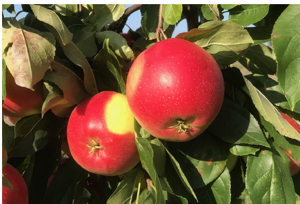
Fig 5 'Minneiska'

Ursprung: ('Meiprinses' x 'Gloster') x 'Elstar', Ben de Sonnaville i Altfröst, Nederländerna. Träd: Medelstort träd med god förgrening men långa grenar som kan få kala partier. Blommar medelsent. Medelhög avkastning. Ganska mottaglig för skorv och mjöldagg. Frukt: Medelstor (158 g) avlångt konformig frukt med kraftiga åsar. Gulgrön grundfärg, till drygt hälften överdragen av en rosaröd och svagt strimmig täckfärg som är ganska blek innan frukten mognat helt. Fast fruktkött med mild och övervägande söt smak och mycket tilltalande arom. Mognadstid: Skördas under mitten till senare hälften av oktober. God lagringsförmåga (4–6 månader). Övrigt: Bör odlas endast i varma lägen för att uppnå god utveckling. Rekommenderas för utökade försök för IP-odling.