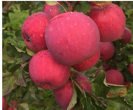
Fig 6 'Reanda'

Kraftigt åsig och ofta sned i formen. Gul grundfärg, till hälften överdragen av en laxröd täckfärg. Mörka lenticellprickar och en hel del rost men ändå tilltalande utseende. Gult, grovt och mycket krasigt gulvitt fruktkött, saftigt och sötsyrligt till söt smak med utmärkt arom. Mycket aromatisk och svagt oxiderande gul juice. Mognadstid: Skördas slutet av augusti till början av september, ganska ojämn mognad. Utmärkt lagringspotential för att vara en så tidig sort (6–8 månader). Övrigt: Excellent mustäpple som trots stor skorvkänslighet borde provas i större skala också som dessertfrukt för IP-odling.