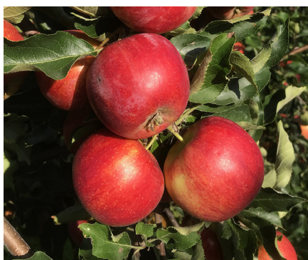
Fig 3 'Early Jonagold'

För att en ny sort ska bli aktuell för introduktion på marknaden, krävs att både odlings- och kvalitetsegenskaper är bättre än hos befintliga sorter. Flera av de här provodlade sorterna har intressanta träd och -fruktegenskaper (Tabell 1–2, Figur 2) men både fruktens och trädens sundhet samt sorternas anpassning till lokalklimatet brister, vilket avspeglar sig i varierande och ibland otillräcklig avkastning. Under de år som sortprovningen har pågått var 2018 ett extremt bra fruktår medan övriga år har inneburit många utmaningar, inte minst när det gäller vårfröster som särskilt 2019 drabbade stora delar av södra Sverige. Det är önskvärt att fortsätta och utöka provningen av de mest intressanta sorterna som beskrivs nedan: 'Early Jonagold', 'Maribelle', 'Minneiska', 'Reanda', 'Rubinstep' och 'Saltanat'.