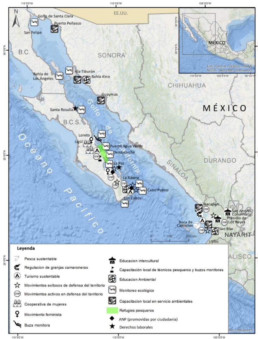
Figura 7. Mapa con acciones, proyectos y posibles soluciones a la problemática socioecológica en el golfo de California.