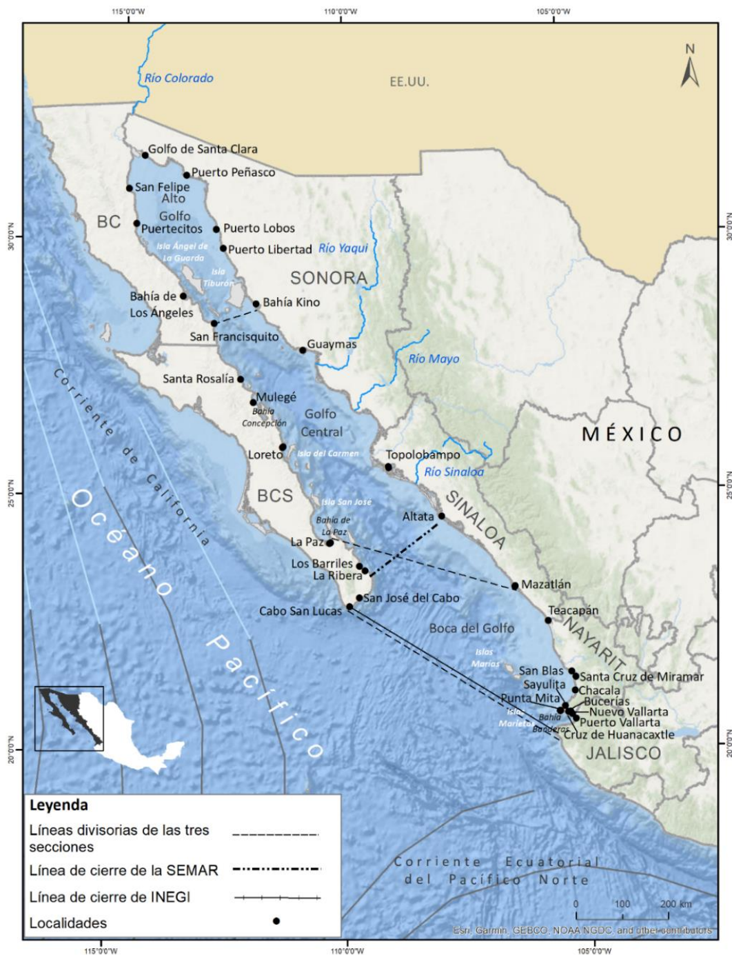
Figura 1. El golfo de California.

Fuente: Información de Creative Commons con atribución (CC - BY) Rulamahue.cl / Christoph Albers (2015). Corrientes marítimas del mundo . Diseño de Marina Hirales, Consultora en SIG, 2019.