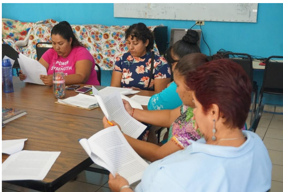
Figura 8. Mujeres de Ligüí, BCS, haciendo lectura colectiva y revisión de su historia.

Fuente: Fotografía de Diego Ramírez, comunidad de Ligüí, BCS, febrero de 2019.