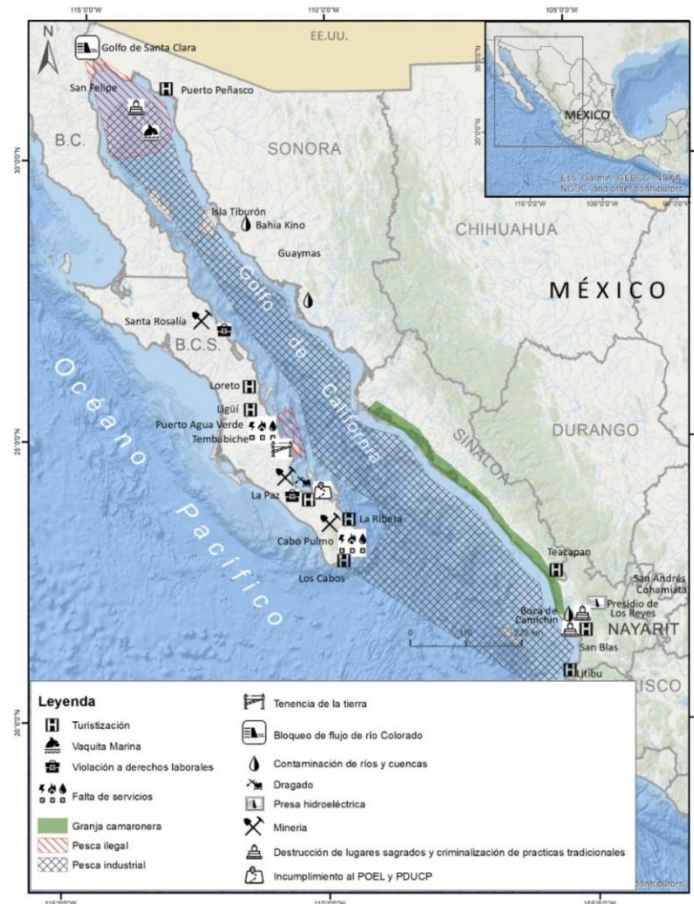
Figura 6. Mapa de las problemáticas socioecológicas en el golfo de California