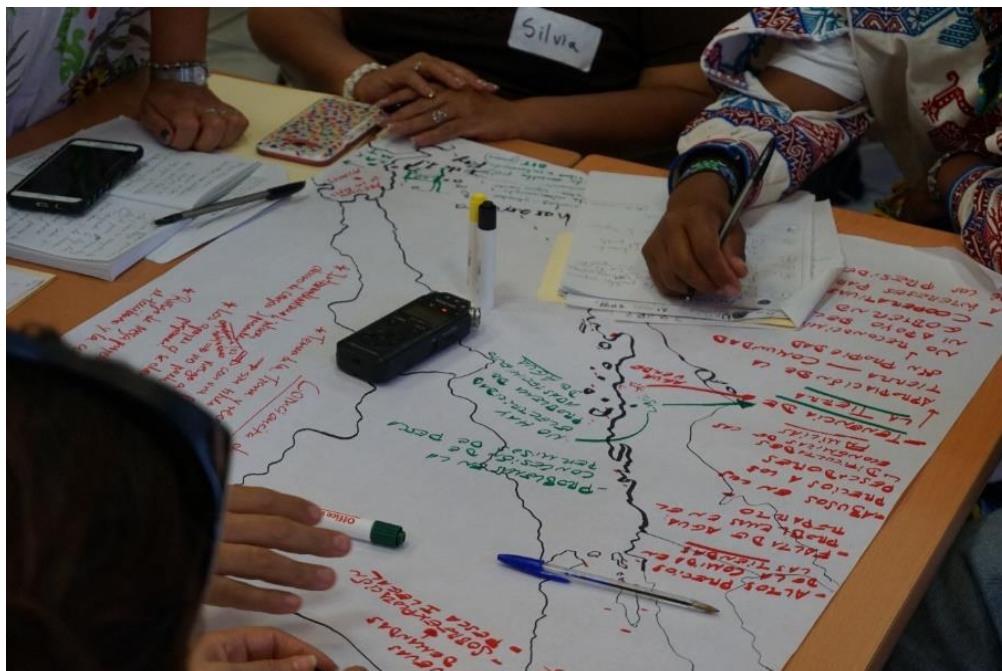
Figura 5. Actividad de cartografía participativa Taller de mayo 2018 que se llevó a cabo en la Universidad Autónoma de Baja California Sur (UABCS), La Paz, BCS, México.