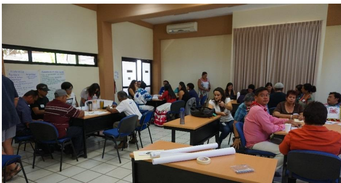
Figura 2. Mesas de diálogo en el Taller de mayo 2018 que se llevó a cabo en la Universidad Autónoma de Baja California Sur (UABCS), La Paz, BCS, México