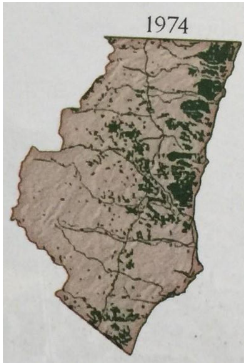
Figura 4. Cobertura de Mata Atlântica do Extremo Sul da Bahia (1974).

Fonte: Robert Ricklefs. A economia da natureza (Rio de Janeiro: Guanabara Koogan, 2008).