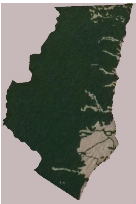
Figura 3. Cobertura de Mata Atlântica do Extremo Sul da Bahia (1946)

Fonte: Robert Ricklefs. A economia da natureza (Rio de Janeiro: Guanabara Koogan, 2008).