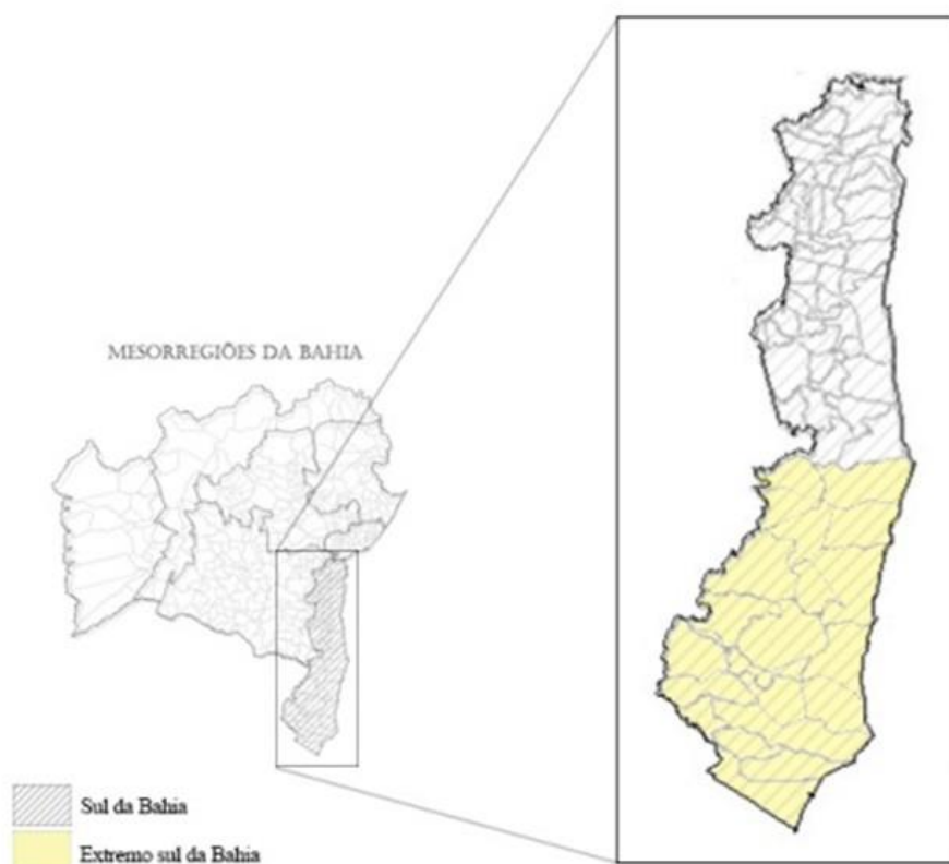
Figura 2. Mesorregiões Sul e Extremo Sul da Bahia (até 2010)