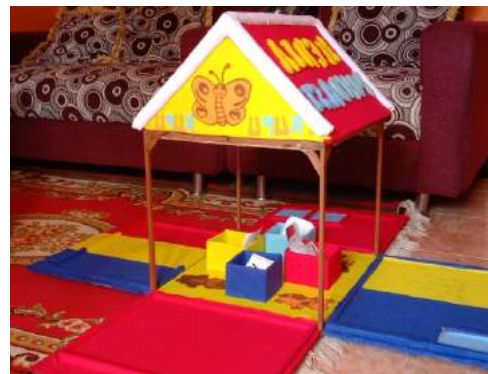
Gambar 2 Bentuk Media PONDASI

Gambar 2 desain produk tampilan bagian dalam, jika 4 (empat) dindingnya dibuka maka berfungsi sebagai lantai untuk menempatkan materi kegiatan problem solving anak. Bagian tengah terdapat 4 kotak untuk menempatkan petunjuk/instruksi kegiatan yang akan dilakukan oleh anak.