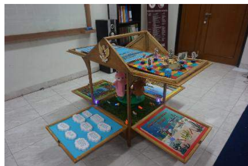
Gambar 1 Bentuk Media PATEMBAYAN

Berdasarkan hasil observasi potensi serta masalah telah ditemukan, sehingga langkah selanjutnya yaitu pengumpulan data dilakukan terkait pada media pembelajaran yang dikembangkan. Hasil observasi yang sudah dilakukan di TKM NU 12 Az-Zahra Pandansarilor Jabung Kabupaten Malang dari 15 anak yang akan diteliti, semua anak sangat antusias dan bersemangat untuk melakukan kegiatan media PONDASI. Penelitian ini pada proses pengumpulan data produk yang akan dikembangkan dari video media PATEMBAYAN (Padepokan Ekosistem dan Budaya Nasional) oleh mahasiswa Universitas Indonesia bentuk mediana adalah sebagai berikut: