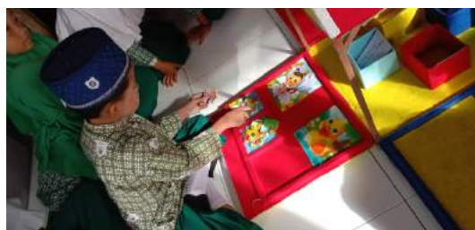
Gambar 5 Kegiatan Media PONDASI pada Ujicoba Lapangan Operasional

Berdasarkan kegiatan media PONDASI pada tahap uji coba lapangan operasional terhadap 15 anak kelompok B di TKM NU 12 Az-Zahra Pandansarilor Jabung Kabupaten Malang terkait dengan pengembangan dalam pelaksanaan kegiatan media PONDASI untuk kemampuan problem solving anak kelompok B diperoleh data hasil uji coba bahwa jumlah penilaian 215 dari jumlah total 240. Jumlah tersebut dipresentasikan sehingga didapatkan hasil 90% dan dapat dikatakan media PONDASI “sangat layak” untuk digunakan. Hasil pengamatan uji coba lapangan operasional respon subjek penelitian senang, mandiri, antusias dan ingin bermain dengan media PONDASI.