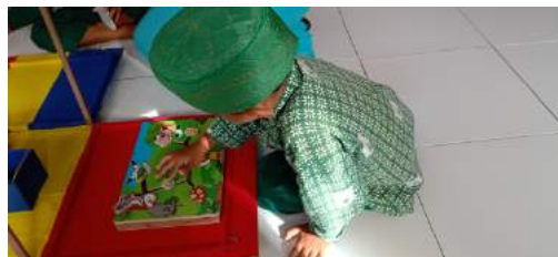
Gambar 4 Kegiatan Media PONDASI pada Ujicoba Lapangan Utama

Berdasarkan kegiatan media PONDASI pada tahap uji coba lapangan operasional terhadap 15 anak kelompok B di TKM NU 12 Az-Zahra Pandansarilor Jabung Kabupaten Malang terkait dengan pengembangan dalam pelaksanaan kegiatan media PONDASI untuk kemampuan problem solving anak kelompok B diperoleh data hasil uji coba bahwa jumlah penilaian 215 dari jumlah total 240. Jumlah tersebut dipresentasikan sehingga didapatkan hasil 90% dan dapat dikatakan media PONDASI “sangat layak” untuk digunakan. Hasil pengamatan uji coba lapangan operasional respon subjek penelitian senang, mandiri, antusias dan ingin bermain dengan media PONDASI.