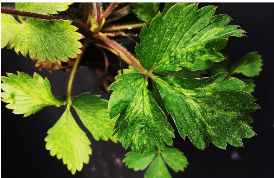
Figura 1. Plantas infectadas com o vírus da faixa das nervuras do morangueiro apresentando sintomas de manchas cloróticas nas margens das nervuras, especialmente próximo à nervura central Figure 1. Plant infected with Strawberry vein banding virus (SVBV) showing chlorotic spots

O RNA foi extraído dos tecidos foliares (cerca de 100g) de plantas infectadas de morangueiro usando o Kit® RNeasy (Qiagen, Hilden, Alemanha), de acordo com as instruções do fabricante, após a maceração inicial em nitrogênio líquido e a homogeneização com 3,5 µl de β-mercaptoetanol e o tampão de lise celular. As amostras foram quantificadas em espectrofotômetro Nanodrop 1000 ( Thermo Fisher Scientific , Califórnia, EUA), e a qualidade foi avaliada através de eletroforese em gel desnaturante de agarose (1%). Amostras de RNA que apresentavam baixas relações espectrofotométricas (relações 260/280 e 260/230) foram precipitadas em etanol (3:1, v/v) e acetato de sódio 3 M (C 2 H 3 NaO 2 ), e ressuspensas em água tra-