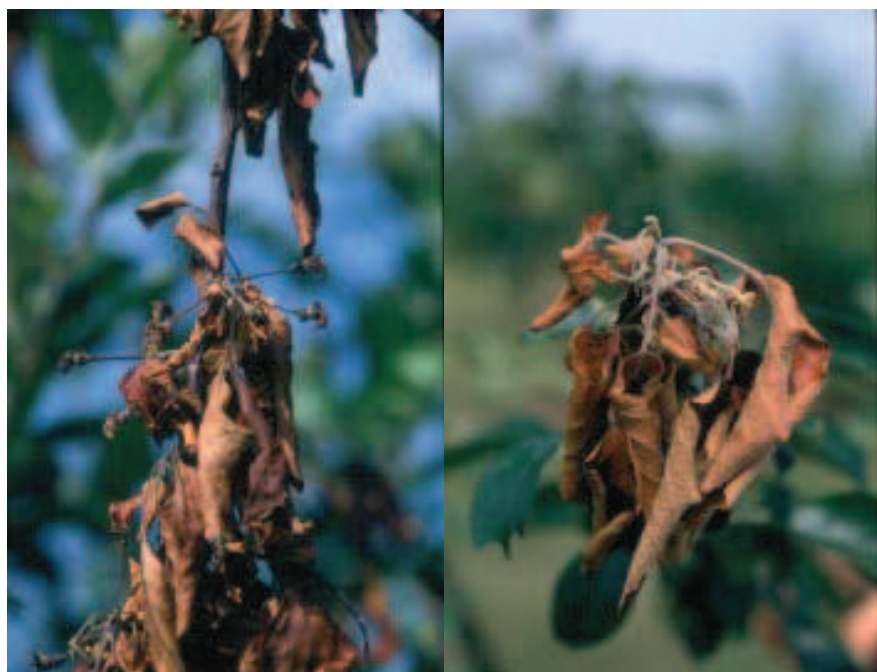
Figura 2. Sintoma do fogo bacteriano na macieira: folhas e frutos firmemente presos no cacho floral morto

Será muito difícil realizar um controle eficiente caso o fogo bacteriano seja introduzido no Brasil. Como medida paliativa, são recomendadas as podas de limpeza para redução do inóculo e as pulverizações com bactericidas específicos, além de produtos cúpricos. Alguns estudos indicam que as pereiras, de um modo geral, e as cultivares de macieira Gala e Fuji, que representam mais de 90% da área plantada no Brasil, são extremamente suscetíveis a esta bacteriose (Breth et al., 2001). No mesmo estudo, estes autores encontraram como muito suscetíveis as cultivares Braeburn, Granny Smith, Jonagold e Jonathan. Por outro lado, as cultivares Golden Delicious, Liberty, Empire, McIntosh, Prima e Priscilla, entre outras, bem como as cultivares