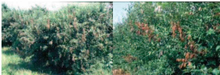
Figura 1. Sintoma do fogo bacteriano na macieira: vista de pomar atacado apresentando ramos de aspecto queimado

O sintoma que melhor descreve a doença é o aspecto de uma planta queimada pelo fogo, daí o seu nome (Figura 1). Ocorre enegrecimento progressivo dos cachos florais, das folhas e dos ramos (Figura 2). Os frutos infectados apresentam manchas escuras, secas e deprimidas e, quando jovens, permanecem aderidos aos ramos. Outro sintoma característico do fogo bacteriano é a curvatura da porção apical dos ramos em crescimento, lembrando um cabo de guarda-chuva ou de