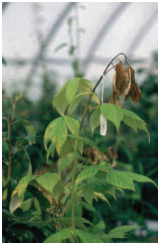
Figura 4. Amoreira com sintoma de fogo bacteriano: encurvamento do ápice, típico da doença

JOHNSON, B.; DEMARREE, A.; BHASKARA-REDDY, M.V. Fire blight of apple rootstocks. The Compact Fruit Tree , v.34, n.1, p.12-15, 2001.