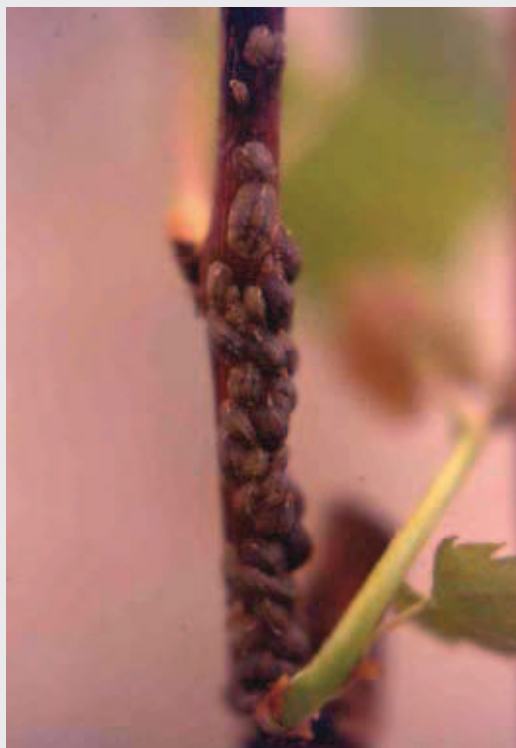
Figura 1. Agrupamento de cochonilhas pardas em ramo de videira. Fêmeas adultas e ninfas de terceiro instar

A evolução dos parâmetros morfométricos está ilustrada na Figura 2. Ninfas de primeiro instar mediram em média 0,58 \pm 0,051 mm de comprimento (mínimo de 0,45mm e máximo de 0,65mm). Ninfas de segundo e terceiro instares atingiram 1,59 \pm 0,092 mm (1,30 a 1,90mm) e 2,50 \pm 0,227 mm (2 a 3,20mm) de comprimento, respectivamente. Fêmeas adultas mediram 7,73 \pm 0,895 mm de comprimento (mínimo de 6mm e máximo de 9,25mm). As medidas de largura acompanharam, proporcionalmente, as medidas de comprimento. ►