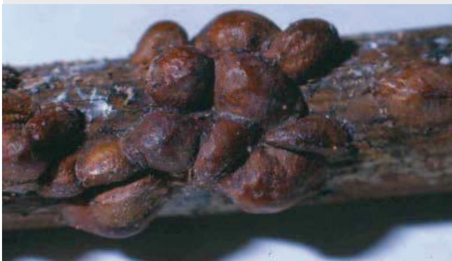
Figura 3. Cochonilha parda em sua coloração marrom-café

ecdise (troca de exoesqueleto) e as ninfas de segundo instar se mantiveram móveis durante todo o inverno. Isto permitiu às ninfas migrarem das folhas para os ramos novos antes da queda das folhas. Na última quinzena de agosto ocorreu a segunda ecdise e as ninfas de terceiro instar se desenvolveram até a primeira quinzena de outubro, quando aparentemente os indivíduos atingiram o estágio adulto. Por ocasião da segunda ecdise, as ninfas não apresentaram