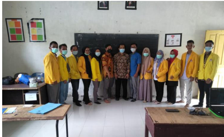
Gambar 2. Tim pengabdian kepada masyarakat

Pada kegiatan pengabdian kepada masyarakat ini dilakukan untuk menjawab permasalahan dari pihak SMA Swasta IT Daarus Sakinah yaitu membantu dalam memperkenalkan Zoom Meeting sebagai media pembelajaran secara online. Pada kesempatan pengabdian ini, kami dibantu oleh mahasiswa Fakultas Teknik Universitas Asahan dalam melakukan pengabdian disekolah tersebut.