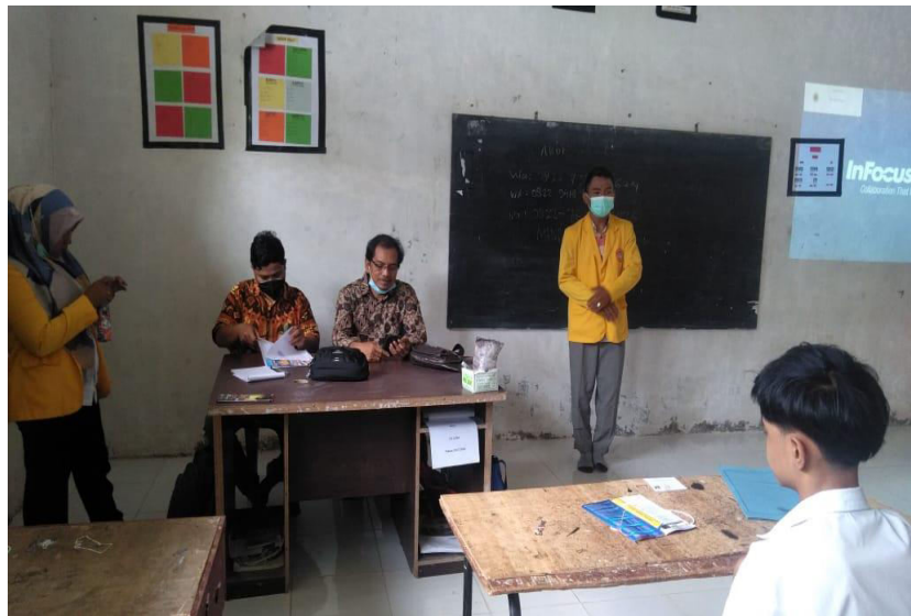
Gambar 3. Acara pembukaan Pengabdian kepada Masyarakat