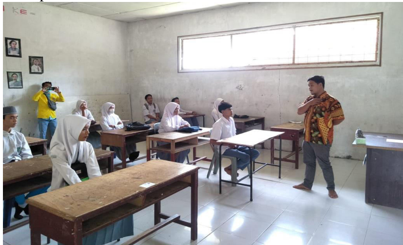
Gambar 4. Pemberian Materi Pengabdian Kepada masyarakat

menggunakan alat berupa infocuscara mendaftar ke zoom serta langkah-langkah penggunaannya. Selanjutnya siswa dan siswi disuruh mempraktekkan langsung menggunakan Hp Android.