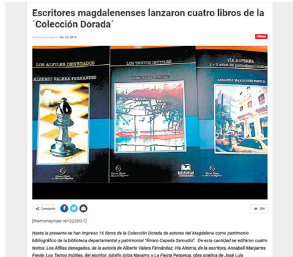
Figura 126. Publicación del periódico Hoy Diario del Magdalena 37

“Por tercera vez, la Gobernación del Magdalena por intermedio de la Oficina de Cultura se hace presente en la Feria Internacional del Libro en Bogotá, en esta ocasión en alianza con la Universidad del Magdalena, institución académica que a través de su editorial realizó la edición de tres de los cuatro libros a lanzarse el domingo venidero. Además, el stand es compartido por las dos instituciones”, declaró en las páginas de su diario, el periódico Hoy Diario del Magdalena (figura 126).