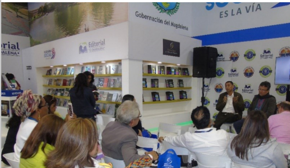
Figura 125. Público asistente a la presentación de la obra