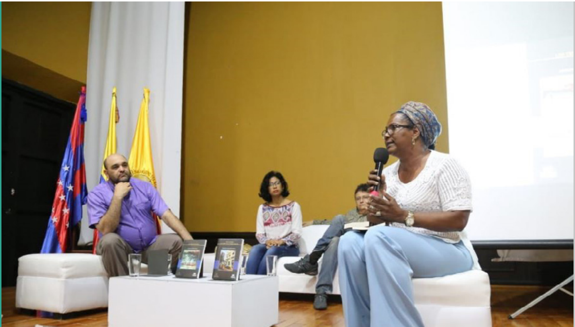
Figura 123. Presentación de la obra en el Claustro San Juan Nepomuceno

Así mismo, el coordinador del fondo Editorial Unimagdalena manifestó sus agradecimientos por los esfuerzos mancomunados que hicieron posible que dos instituciones del departamento del Magdalena, como lo es la Gobernación y la Universidad se unieran para la coedición de las obras de la Colección Dorada.