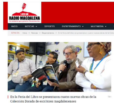
Figura 128. Nota periodística de Radio Magdalena 39