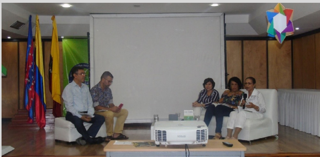
Figura 7. Presentación del libro en la Feria del Libro de Santa Marta, FILSMAR 2019

Los autores de libro participaron en un conversatorio en el auditorio Julio Otero (figura 7), con motivo del lanzamiento del libro. Los coautores le contaron al público asistente de qué trata la obra, qué los motivó a escribirla y cómo se encuentra estructurada.