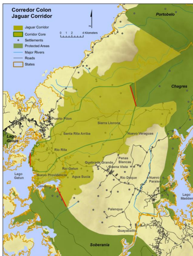
Fig. 1. Vista panorámica del área de estudio (Sierra Llorona). Parte del Corredor biológico, Corredor Colón Jaguar. Línea verde: Área de interés del estudio, líneas rojas: límites del territorio con áreas protegidas. Mapa proporcionado por la Sociedad Mastozoológica de Panamá (SOMASPA).