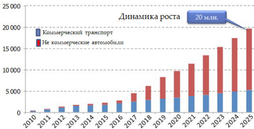
Рис. 3. Динамика роста в России количества подключенных автомобилей [16].