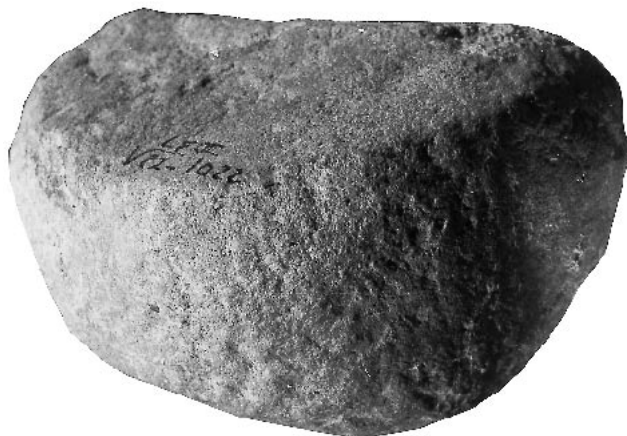
Fig. 7 – Molette en grès micacé du Magdalénien V (couche 5) de l'abri de La Faurélie II, n° V22.1022 (diam. 8,6 cm, ép. 4,8 cm). Pourtour circulaire entièrement façonné par piquetage. Face préservée aplaniée et polie par usure, avec stries parallèles visibles à la loupe binoculaire. Fouilles J. Tixier.