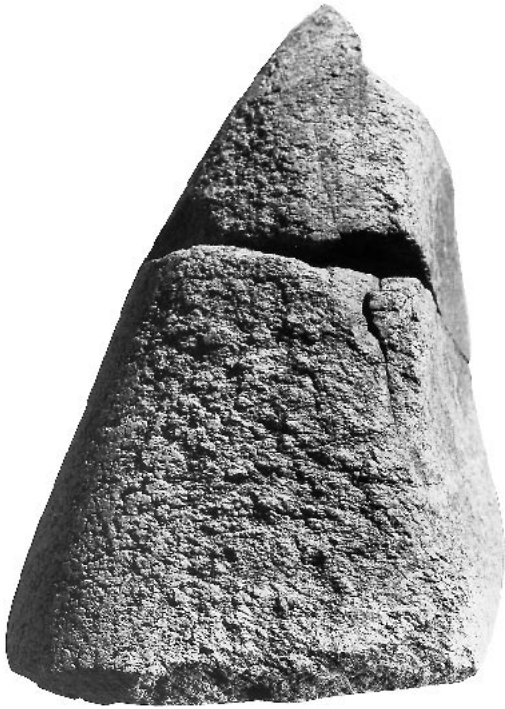
Fig. 2 – Pilon-broyeur tronconique en granite du Magdalénien supérieur (couche VIII) de l'abri du Flageolet II, n° 15' - c. VIII - 5 (13,3 × 10,1 × 7 cm). Flancs partiellement polis peut-être par suite d'une mise en forme mais le granite est trop altéré qu'on puisse trancher sur l'origine de ce poli. Par contre, le poli de la base de ce pilon est dû à l'usure. Fouilles J.-Ph. Rigaud.

qu'à un groupe restreint puisque la zone abritée n'excédait pas 100 m 2 (Célérier, 1993). Ceci suggère une forme d'occupation de l'abri qui s'organiserait autour de séjours brefs, probablement à la belle saison, d'après l'ichtyofaune. On peut s'étonner de n'y avoir pas trouvé d'autres outils sur galet mais la superficie fouillée n'excédait pas 25 m 2 , soit un quart de la surface totale de l'abri.