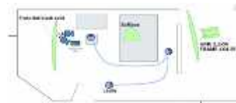
Gambar 4. 3 floorplan pada scene 14

) 14. INT. KAMAR DARA - NEXT DAY CAST : LAURA