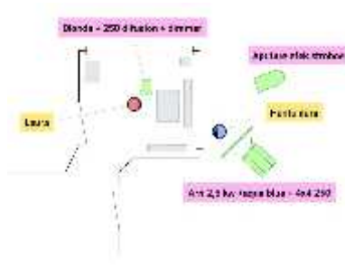
Gambar 5. 7 floorplan Dara memperlihatkan diri ke Laura

Scene ini adalah puncak dari film “Derana Dara” pada scene ini hantu Dara menunjukan kepada Laura rasa ingin balas dendam. Tata cahaya yang digunakan pada scene ini menggunakan teknik high contrast untuk mendukung unsur dramatis,