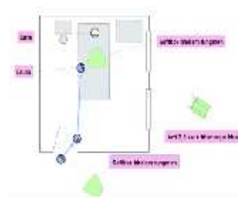
Gambar 5. 3 screenshot , floorplan INT kamar Dara Bunuh diri

Scene ini menunjukkan unsur dramatis curiosity atau rasa ingin tau Laura, ketika makanan di meja masih utuh dan hendak mengantar makan