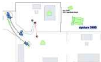
Gambar 4. 4 floorplan pada scene 30

Pada scene ini adalah ending dari film horor “Derana Dara” karena pembalasan dendam Dara untuk membunuh Laura dalam scene ini akan didukung dengan tata cahaya high contrast sebagai pendukung unsur dramatisakan menggunakan perbandingan 1:16 dimana menciptakan logika ruangan ketika