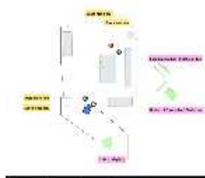
Gambar 5. 5 screenshoot dan floorplan Laura melihat kejadian dimasa lalu sedang menyiksa Dara

Unsur dramatis pada scene ini didukung dengan tata cahaya high contrast untuk menunjukkan kesedihan yang dirasakan Dara pada masa hidupnya. Ketika lampu menyala, terlihat Laura masa lalu sedang menyiksa Dara, Laura yang sedang melihat kejadian itu merasa tidak percaya akan yang dilakukan pada masa lalu. Tata cahaya high contrast pada scene ini menggunakan teknik pictorial light dimana lampu blonde akan hidup perlahan untuk memperlihatkan adegan Laura menyiksa Dara, blonde akan dihidupkan dengan menggunakan dimmer agar lampu bisa hidup dengan perlahan. HMI ARRI 2,5 KW dengan tambahan filter cosmetic aqua blue mempresentasikan cahaya bulan dan membangun mood menakutkan di dalam scene ini. Perhitungan ratio 1:16 key light f/5.6 dan fill light f/1.4 ketika lampu mati, berubah perhitungan menjadi 1:4 key light f/5.6 dan fill light f/2 ketika lampu menyala. Penggunaan kaca untuk memnatulkan cahaya yang tidak