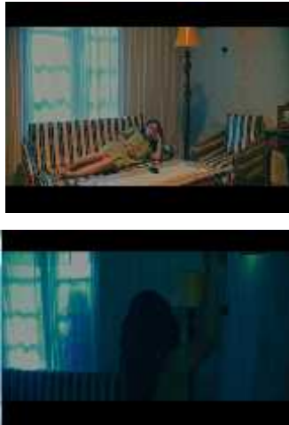
Gambar 5. 6 screenshoot Dara memperlihatkan diri ke Laura

dapat dijangkau oleh lampu dengan tambahan filter brush slik agar cahaya tetap keras namun bayangan yang dihasilkan lembut.