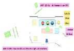
Gambar 5. 2 floorplan adegan keluarga Laura yang bahagia dan harmonis

Unsur dramatis senang atau bahagia dalam scene ini melalui high contrast untuk mendukung suasana yang dirasakan oleh keluarga Laura saat merayakan ulang tahun Dara. Dalam scene ini menggunakan artificial light .