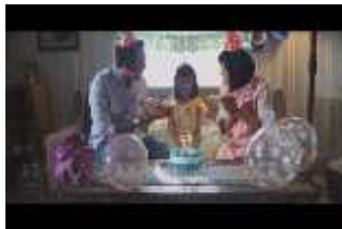
Gambar 5. 1 screenshot adegan flashback keluarga Laura yang bahagia dan harmonis

contrast untuk membangun unsur dramatis didalam film “Derana Dara”. Tujuannya agar tata cahaya pada film dapat membangun unsur dramatis dengan dukungan high contrast , terhadap penonton yang melihat karya film ini.