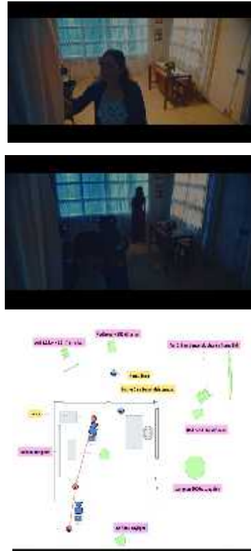
Gambar 5. 4 screenshot dan floorplan penampakan hantu Dara.

Pada scene ini pertama kali hantu Dara muncul dihadapan Laura didalam kegelapan tetapi Laura tidak mengetahui siapa sosok didalam kegelapan itu. Pada scene ini tata cahaya high contrast mendukung unsur dramatis kejutan ketika tiba-tiba hantu Dara berada didalam rumah ketika Laura mematikan lampunya.