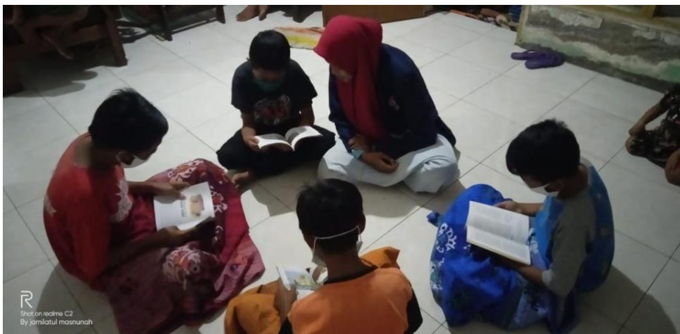
Gambar 3 : Pelaksanaan Kegiatan Literasi Cerdas yang dilakukan di rumah siswa secara berkelompok dengan mengikuti protokol kesehatan