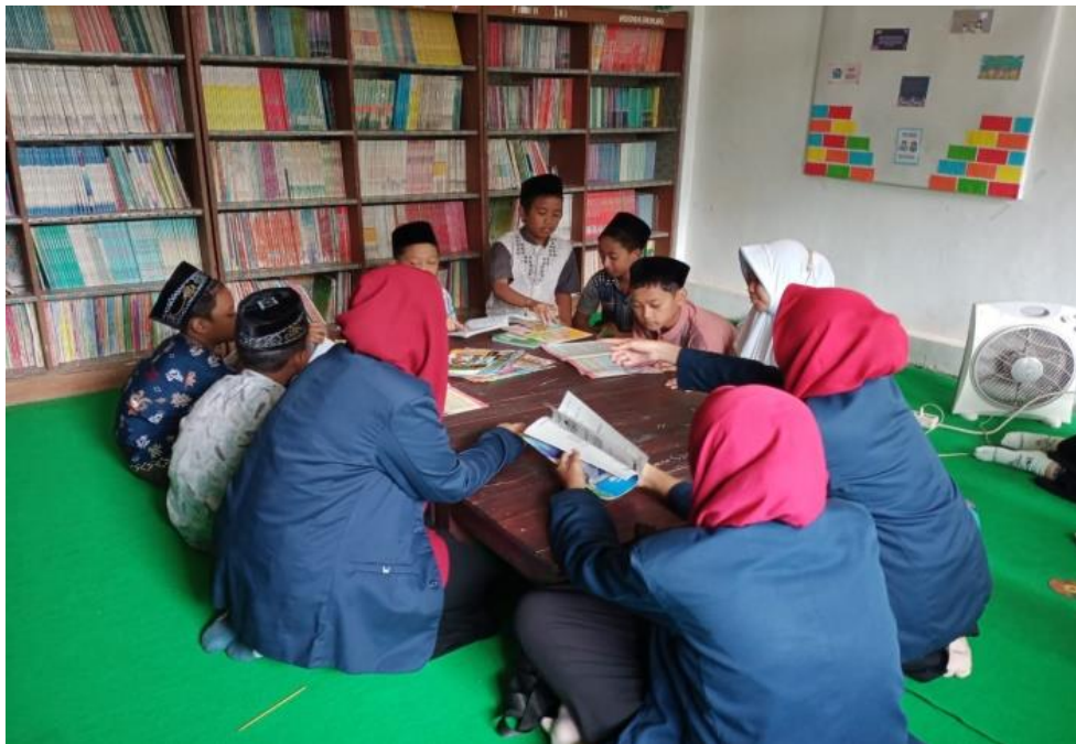
Gambar 2 : Peserta didik sedang melaksanakan kegiatan literasi cerdas bersama tim pendampingan di ruang perpustakaan