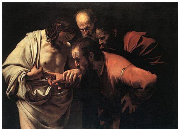
4. CARAVAGGIO Incredulità di San Tommaso