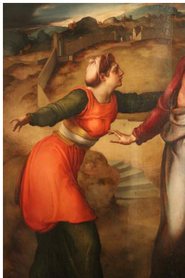
3. PONTORMO Noli me tangere (particolare)