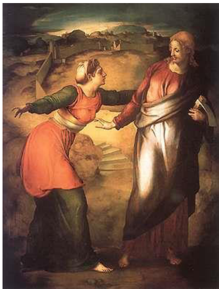
2. PONTORMO Noli me tangere