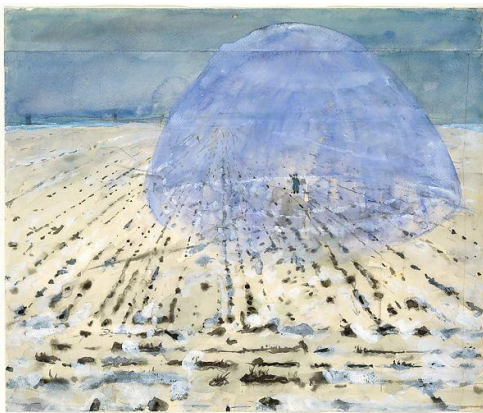
6. ANSELM KIEFER Everyone Stands Under His Own Dome of Heaven