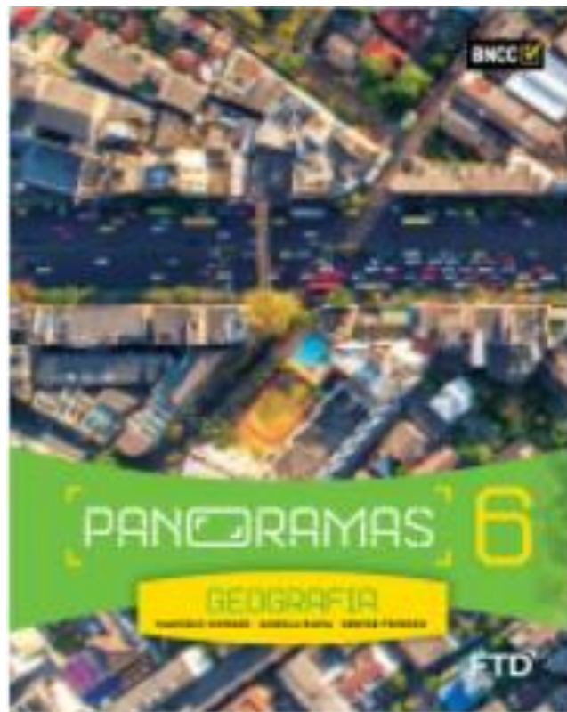
Figura 1 – Capa do Livro do 6º ano (abaixo da imagem)

Em primeiro lugar, o planejamento com a professora supervisora ocorreu semanas antes, no mês de novembro de 2020, no qual, ela me orientou sobre como era a sua metodologia em sala de aula, assim como também me apresentou os livros didáticos (Figura 1). Esses, na percepção dela, deixavam um pouco a desejar no quesito atualidades. Ainda, me atualizou que os livros já seguiam as normas que são colocadas pela Base Nacional Comum Curricular (BNCC).