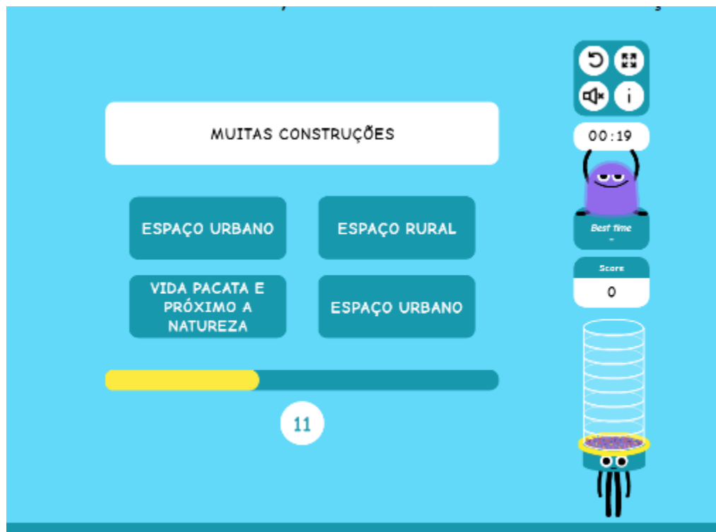
Figura 2 – Interface Educandy

como utilizar pelo site no computador. Nessa plataforma pode-se realizar jogos como, caça-palavras, questionários, palavra cruzada, quebra cabeça entre outros. Depois que é realizado o login o professor pode confeccionar o questionário que quiser.