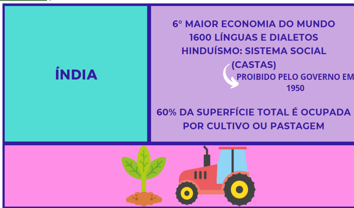
Figura 6 – Apresentação das aulas

É importante lembrar que no 8º ano havia alunos com limitações, mais especificamente com Transtorno do Espectro Autista (TEA), como dito anteriormente, nesses casos a utilização da plataforma Educandy auxiliou a dinamizar mais o processo de aprendizagem desses alunos. Outro ponto destacado, foi a preocupação da professora em fazer materiais, como slides, com cores chamativas e muitas imagens, para atrair a atenção dos com TEA.