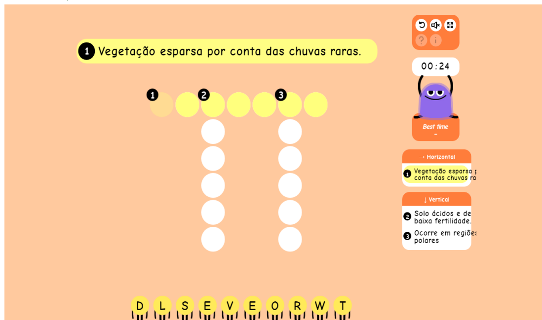
Figura 4 – Caça-Palavras