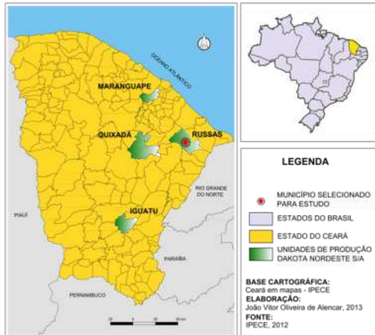
Figura 01 – Unidades de produção da Dakota Nordeste no Ceará

empresa Dakota Nordeste S/A iniciaram suas atividades no Ceará em 1995, após uma desconcentração espacial da produção inicialmente realizada no Rio Grande do Sul (Figura 01).