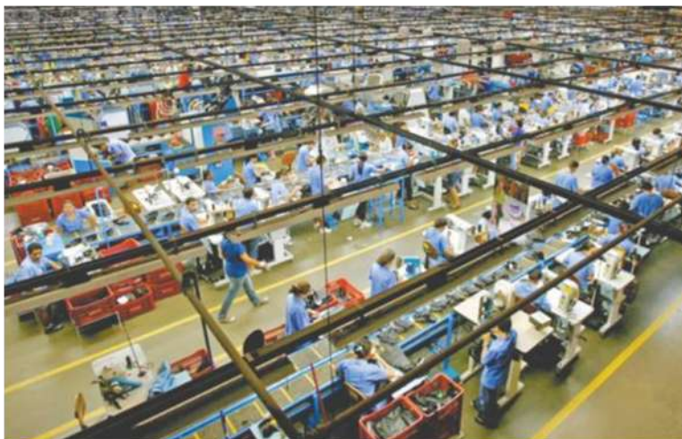
Figura 02 – Esteiras de produção da unidade de produção da Dakota Nordeste em Russas.

A diferença de um auxiliar para o “peão”, isto é, a diferença entre o maior e o menor grau de hierarquia da esteira, sem levar em consideração o gerente, caracteriza-se no acréscimo de R$ 10,00 no salário somado a horas de trabalho extra.