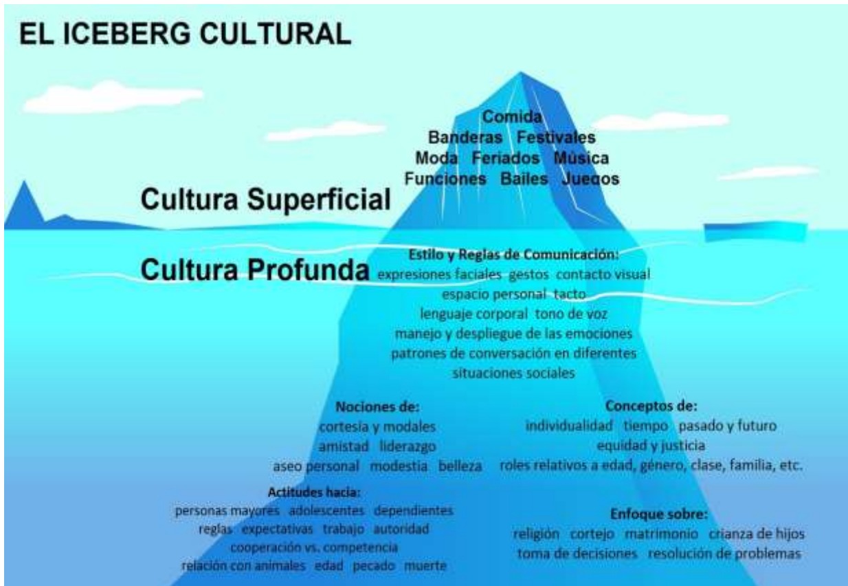
Figura 3. Concepto de Iceberg Cultural