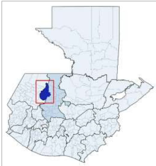
Figura 1. Municipio de Nebaj, departamento de Quiché