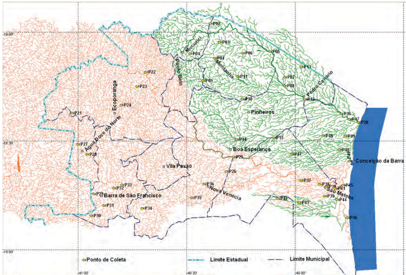
Figura 1. Mapa das bacias do norte do Espírito Santo: rio Itaúnas (verde) e rio São Mateus (laranja), indicando o oceano (azul), os limites dos municípios (linha tracejada) e os 49 pontos de amostragem; para identificação e caracterização dos pontos, veja o Apêndice 2 e as Figuras 3 e 4.

Rio Itaúnas. O rio Itaúnas localiza-se ao sul da Bahia e a nordeste de Minas Gerais, no extremo norte capixaba, tendo suas nascentes principais nos municípios de Ponto Belo e Mucurici. É um rio de domínio estadual, mas a bacia tem as nascentes no córrego Barreado, em Minas Gerais, no município de Nanuque, e a de outros córregos na Bahia, no município de Mucuri. Sua bacia drena uma área de 4.314 km 2 em território capixaba. Limitada a norte e oeste, em seu trecho superior, pela bacia do rio Mucuri, em Minas Gerais e Bahia, e ainda a norte, em seu baixo curso fluvial, pelas microbacias de Riacho Doce, na divisa entre Espírito Santo e Bahia. Ao sul, os limites da bacia do Itaúnas são definidos pela bacia do São Mateus, também no Espírito Santo (Figura 2). As águas da bacia do rio Itaúnas banham os municípios capixabas de Mucurici, Montanha, Pinheiros, Pedro Canário e parte dos municípios capixabas de Ponto Belo, Boa Esperança, São Mateus, Conceição da Barra e ainda parte do município de Mucuri, na Bahia. As unidades de conservação situadas na bacia do Itaúnas incluem a Floresta Nacional do Rio Preto, a Reserva Biológica de Córrego Grande, a Reserva Biológica do Córrego do Veado e o Parque Estadual de Itaúnas.