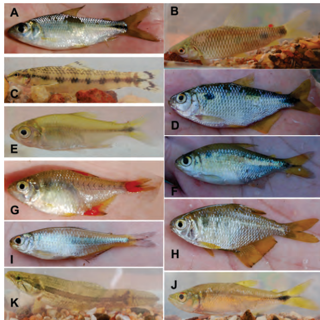
Figura 5. Espécies de peixes das bacias do norte do Espírito Santo. A- Cyphocharax gilbert ; B- Leporinus copelandii ; C- Characidium sp. 3 aff. C. fasciatum ; D- Astyanax sp. 2 aff. A. lacustris ; E- Astyanax sp. 3 aff. A. intermedius ; F- Astyanax sp. 5 aff. A. rivularis ; G- Hyphessobrycon bifasciatus (macho); H- Hyphessobrycon bifasciatus (fêmea); I- Knodus sp. aff. K. moenkhausii ; J- Oligosarcus acutirostris ; K- Hoplias malabaricus .

As espécies consideradas constantes foram Characidium sp. 3 aff. C. fasciatum (Figura 5C) e Geophagus brasiliensis (Figura 6T), com presença em mais da metade dos pontos amostrados. Foram nove espécies acessórias: Poecilia vivipara (Figura 6R), Astyanax sp. 2 aff. A. lacustris (Figura 5D), Astyanax sp. 3 aff. A. intermedius (Figura 5E), Astyanax sp. 5 aff. A. rivularis (Figura 5F), Hypostomus scabriceps (Figura 6O), Hypostomus sp., Trichomycterus pradensis (Figura 6L), Hoplias malabaricus (Figura 5K) e Otothyris travassosi . As