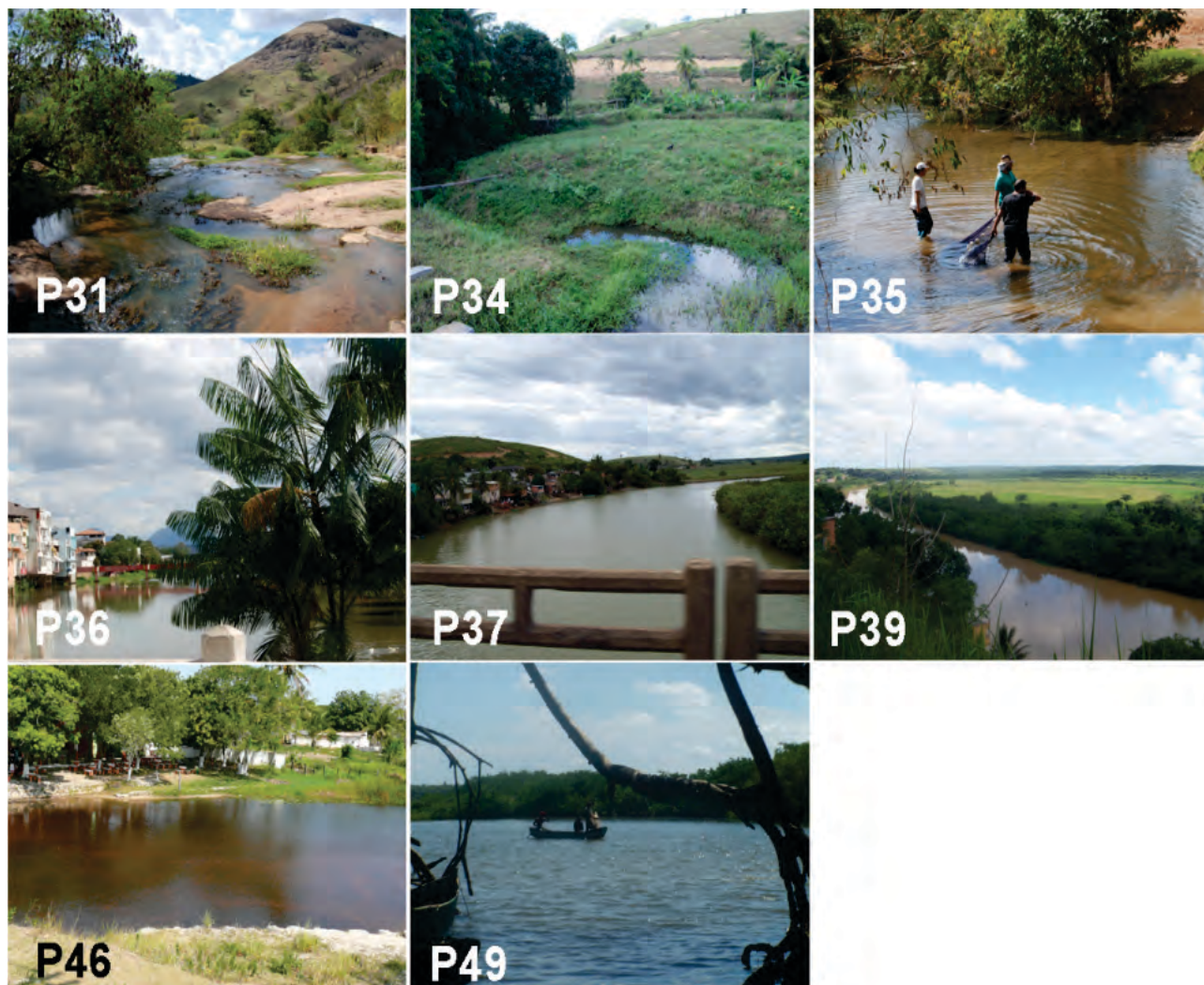
Figura 4. Pontos de amostragem ao longo das bacias norte do Espírito Santo; para identificação e caracterização dos pontos, veja o Apêndice 2.

e rios que drenam para o rio São Mateus após a união dos rios Cotaxé e Cricaré. O manguezal do rio São Mateus exibe fisionomia alterada por tensores naturais e antrópicos, tendo como agentes principais: erosão, assoreamento, desmatamento, invasão por palafitas, abertura de estradas, urbanização, lançamento de efluente doméstico e pesca predatória (Silva et al. 2005). O Baixo Rio São Mateus banha parcialmente os municípios de São Mateus, Jaguaré e Conceição da Barra. Em Conceição da Barra a população refere-se ao rio São Mateus como rio Cricaré.