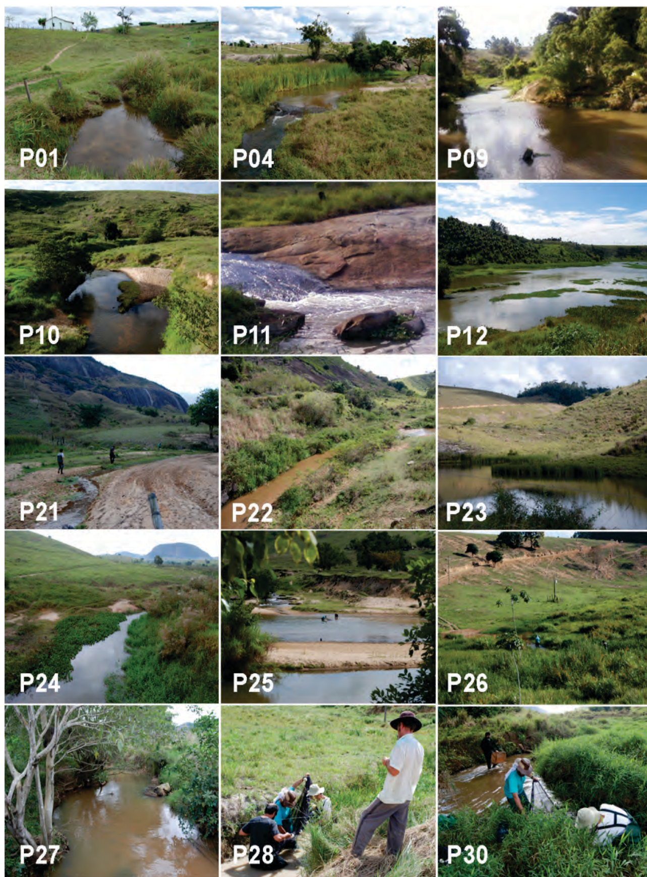
Figura 3. Pontos de amostragem ao longo das bacias do norte do Espírito Santo; para identificação e caracterização dos pontos, veja o Apêndice 2.