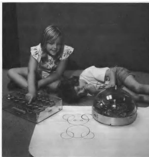
Figura 1. Imagen de un niño y una niña junto a la “tortuga” Irving y utilizando el programa LOGO, extraída del libro de Mindstorms de Seymour Papert, 1980.

Posteriormente al desarrollo de LOGO, surgió una colaboración con LEGO que permitió la relación entre la construcción física y lo programado en el ordenador (Hernández y Vega, 2016), dando lugar de alguna forma al primer kit de robótica de Lego Mindstorms, así como el más conocido y usado a nivel mundial, y que debe su nombre a la publicación de Papert llamada Mindstorms: Children, Computers, and Powerful Ideas (Alimisis y Kynigos, 2009).