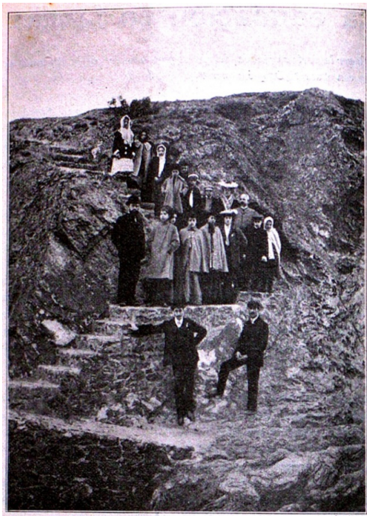
FIGURA 2 – RECORDAÇÃO DA EXCURSÃO CIENTÍFICA A BANYULS-SUR-MER (FRANÇA), COM O GEÓLOGO ODON DE BUEN