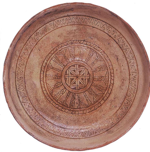
Fig. 6 : Céramique byzantine de type Fine Sgraffito Ware (d'après D. Papanikola-Bakirtzis, Byzantine Glazed Ceramics: the Art of Sgraffito , Athènes, The Archaeological Receipts Fund, 1999, p. 137)

à travers les types iconographiques – oiseau se détachant sur un fond de rinceaux isolé dans un médaillon ou bandeau de lettres pseudo-coufiques. Ces coupes dont une partie est fabriquée à Corinthe s'apparentent nettement à des vases réalisés en Perse occidentale aux X e -XI e siècles dont aucun exemplaire n'été retrouvé sur le sol byzantin (fig. 7). Leur absence pose alors le problème du mode de transmission des décors et/ou du savoir-faire qui a dû s'opérer à travers d'autres intermédiaires que la poterie ou qui résulte de transferts d'artisans. Plus tard, dans la deuxième moitié du XIII e siècle, les ateliers corinthiens produisent une vaisselle profondément marquée par les importations italiennes en nette augmentation à cette période sur le site. Il y a là une relation très nette entre une demande spécifique auxquelles répondent des importations et une adaptation de la production locale.