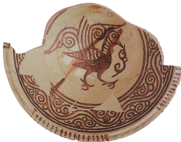
Fig. 5 : Coupe corinthienne peinte à l'engobe rouge d'après D. Papanikola-Bakirtzis, Byzantine Glazed Ceramics: the Art of Sgraffito , Athènes, The Archaeological Receipts Fund, 1999, p. 160)

Cependant l'artisan byzantin ignore tout des moyens techniques mis en oeuvre pour une telle réalisation. L'émail et le lustre lui sont inconnus, aussi recourt-il à d'autres moyens pour s'approcher au plus près de l'effet souhaité, c'est-à-dire un engobe blanc couvert d'une glaçure plombifère incolore pour simuler l'émail et un engobe teinté de rouge pour rendre le lustre (fig. 5).