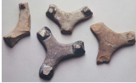
Fig. 1 : Pernettes

Cette opération est délicate car il convient tout à la fois de remplir le four de façon compacte afin de minimiser la perte de chaleur et de rentabiliser la fournée, sans toutefois entasser les céramiques glaçurées au risque de les retrouver collées les unes aux autres. Des tessons de pièces manquées disposés entre les objets contiguës et de petits cylindres d'argile grossière permettaient jusqu'alors d'éviter ces incidents ; ils sont avantageusement remplacés par les pernettes dont l'utilisation à Byzance se généralise sans toutefois devenir systématique 13 (Fig. 2).