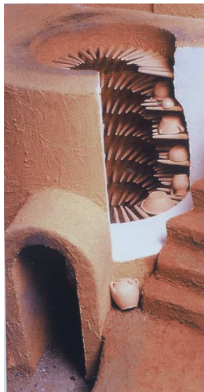
Fig. 3 : Restitution d'un four à barres. Maquette de Pierre Vallauri. Avec l'aimable autorisation de l'artiste ( Le Vert et le Brun , Marseille 1995, p. 36).

Les fours de potiers construits à Byzance sont du type dit à flammes nues; de plan circulaire, un fort pilier central ou plusieurs petits piliers supportent la chambre de cuisson et soutiennent la sole percée d'un nombre variable de trous. La forme extérieure du four correspond à un dôme avec une ouverture au sommet qui assure le tirage du foyer 17 . Or des barres d'enfournement en terre cuite ont été trouvées à Serres en Macédoine 18 ; elles indiquent qu'un autre type de four est alors en usage dans le monde byzantin à la fin du XIII e -début XIV e siècle. Il s'agit cette fois d'un four équipé d'étagères faites de barres d'argile enfoncées dans la paroi qui soutiennent les vases à cuire (Fig. 3). Ce four est caractéristique du monde islamique 19 . Aussi sa présence en Grèce du Nord est d'autant plus surprenante que la céramique réalisée dans cet atelier est une production de tradition byzantine.