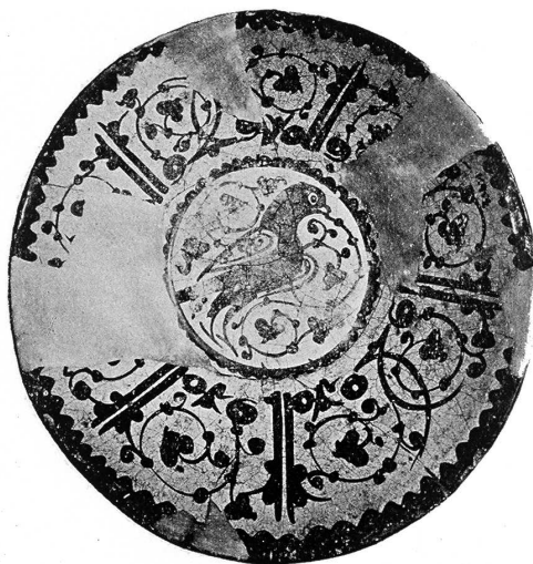
Fig. 4 : Coupe fatimide peinte au lustre métallique, Musée d' Art islamique, Le Caire,

vase corinthien qu'il serait tentant de considérer comme la copie d'une coupe fatimide égyptienne tant les ressemblances entre les deux sont criantes (Fig. 4).