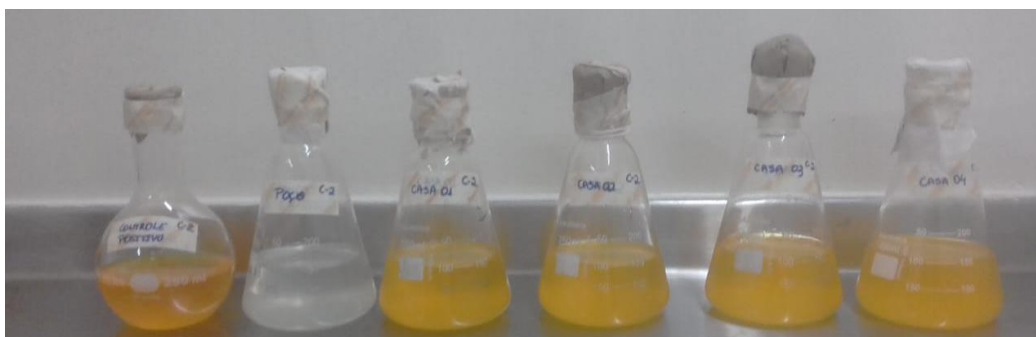
Figura 3. Resultado das análises para coliformes totais nas coletas do período de junho após o primeiro período de incubação.

2017, part. 9223b, p. 3). As amostras que permaneceram incolores após 48 h de incubação foram consideradas negativas para coliformes totais e coliformes termotolerantes, e as que apresentaram coloração amarelada foram invalidadas (American Public Health Association, 2017, part. 9223b, p. 3).