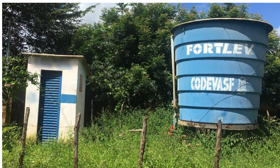
Figura 1. Chafariz do povoado Barra Nova, Cocal de Telha (PI) com o centro de operação da bomba d'água a esquerda e o reservatório de água a direita, e centralizado entre ambos, o poço tubular.

A distribuição de águas do povoado ocorre por meio de um chafariz. As águas são captadas do poço tubular por uma bomba que a canaliza diretamente para um reservatório que a distribui posteriormente para as residências (Figura 1). O Sistema de Distribuição de Águas (SDA) é considerado do tipo fechado, pois a água é distribuída exclusivamente para o povoado, não estando interligado a nem um SDA de outros povoados ou bairros da cidade.