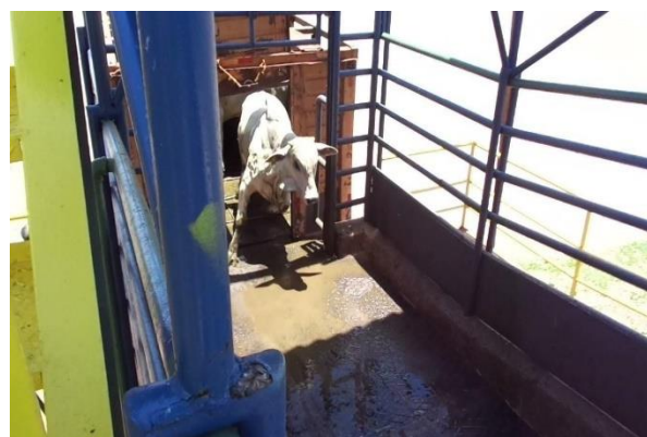
Figura 3. Registro do deslizamento de um bovino no momento da chegada ao abatedouro frigorífico devido à presença de umidade e sujidades na rampa de desembarque que predispunha os animais a elevada frequência de contusões.

predispunha os animais a um excessivo número de deslizamentos (Figura 3). É importante enfatizar que a angulação das rampas observada nessa pesquisa atendia aos parâmetros de bem-estar descritos na literatura, sendo no máximo 20 graus, o que permite aos animais não escorregar numa frequência equivalente a 3% das vezes.