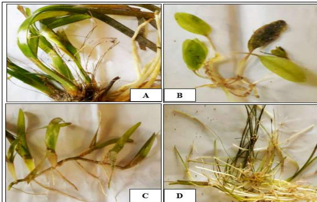
Gambar 2. Jenis lamun yang Ditemukan di perairan Kubur Cina Kelurahan Lewoleba Tengah Kecamatan Nubatukan Kabupaten Lembata : (a) Enhalus acroides , (b) Halophila ovalis , (c) Thalassia hamprichi dan (d) Halodule uninervis

Jenis-jenis lamun yang ditemukan di perairan Kubur Cina Kelurahan Lewoleba Tengah Kecamatan Nubatukan Kabupaten Lembata dapat dideskripsikan sebagai berikut menurut Kuo dan Hartog, (2006) :