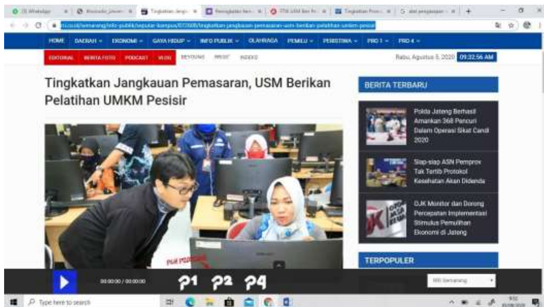
Gambar 2. Luaran Publikasi di Media Masa

Luaran yang dihasilkan adalah kemampuan peserta dalam menggunakan sosmed untuk promosi produk. Kemampuan pemahaman peserta diperoleh berdasarkan hasil evaluasi terhadap peserta didik. Melalui Peningkatan kemampuan ini, diharapkan masyarakat dapat memanfaatkan dan menerapkan teknologi informasi sebagai media untuk promosi poduk, sehingga masyarakat dapat kreatif memanfaatkan facebook dan instagram un tuk mendukung usaha/ bisnisnya.