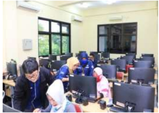
Gambar 1. Tim Pengabdian sedang Membimbing Peserta

Metode yang akan dilaksanakan dalam kegiatan ini adalah metode ceramah dan praktek. Sebelum dimulai kegiatan praktek diawali dengan pengenalan sosial media. Pengenalan digunakan untuk membantu peserta didik dalam menggunakan sosial media seperti faceook dan instagram sebagai proses untuk tahap promosi produk. Kegiatan Peningkatan kemampuan ini bertempat di Kelurahan Tambakrejo Semarang. Setiap peserta menggunakan 1 unit komputer selama praktik berlangsung. Kegiatan dilaksanakan dalam 1 (satu) hari dengan durasi Peningkatan kemampuan adalah 4 (empat) jam, terdiri dari : 30 menit pengenalan Sosmed, 180 menit untuk praktek membuat promosi di Facebook dan Instagram, dan 30 menit untuk evaluasi keseluruhan materi.