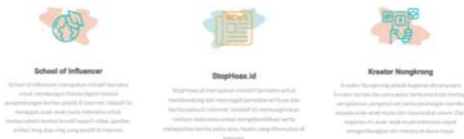
Gambar 3. Kegiatan Siberkreasi

Ancaman radikalisme pada generasi millennial dipengaruhi oleh berbagai faktor seperti media dan teknologi, pendidikan, dan nilai sosial (Subagyo, 2015; Zamzamy, 2019). Oleh karena itu, perlu peningkatan kemampuan literasi digital sebagai pencegahan radikalisme pada generasi muda. Upaya preventif dalam dilakukan dengan menggunakan kontra radikalisasi dengan memanfaatkan berbagai kegiatan yang diadakan oleh Siberkreasi seperti yang ditunjukkan pada Gambar 3. Literasi digital diibaratkan sebagai vaksin untuk menjaga daya tahan tubuh (D. Rahmat, Aliza, & Putri, 2019; Rianto, 2019). Sedangkan, radikalisme sebagai sebuah penyakit yang dapat menyerang siapa saja dan kapan saja. Jika telah diberikan vaksin, maka setidaknya seseorang lebih terlindungi dari berbagai penyakit. Dengan demikian, literasi digital menjadi tameng supaya dapat menangkal terpaparnya radikalisme pada generasi millennial. Berpegang pada literasi digital diharapkan seseorang sebagai pengguna internet mampu menyaring informasi, apakah informasi itu benar atau tidak, dan mampu menghindari dari terpaparnya paham radikal.