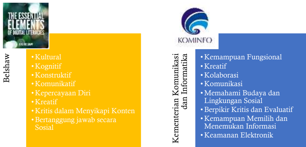
Gambar 1. Indikator Kemampuan Literasi Digital

Berdasarkan Gambar 1 di atas, diketahui terdapat perbedaan indikator penguasaan literasi digital bagi generasi millennial. Berdasarkan data Siberkreasi (dalam Santoso et al., 2020) didapatkan kondisi penguasaan literasi digital generasi muda Indonesia berada dalam tingkat sedang dengan rata-rata nilai berada di atas 80%. Data ini dapat disajikan dalam Gambar 2 berikut ini: