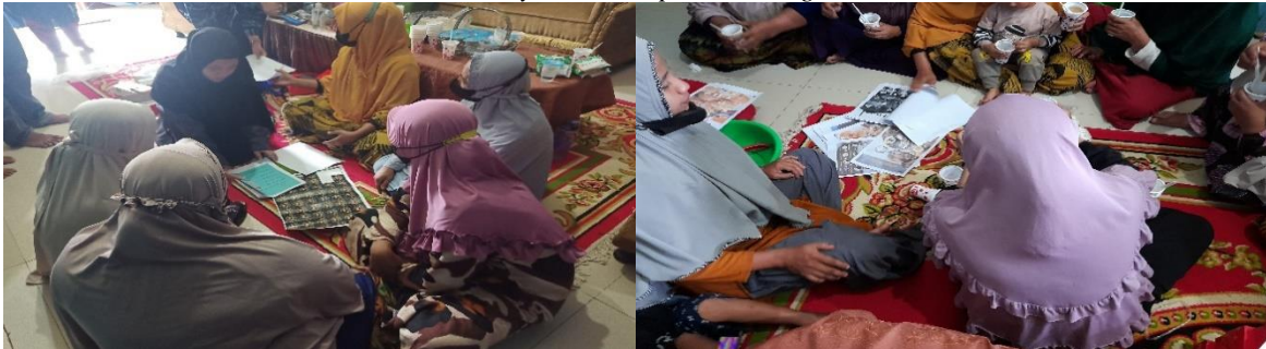
Gambar 7. Ibu PKK mempelajari Modul