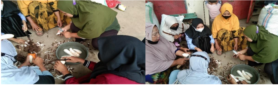
Gambar 6. Mengolah Pangan Alternatif

Mewujudkan Pemberdayaan Perempuan Desa Borong Loe dalam Perekonomian Desa Benteng Gantarang.