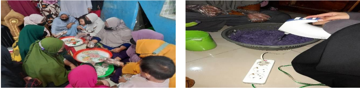
Gambar 8. Ibu PKK Membuat Pangan alternatif