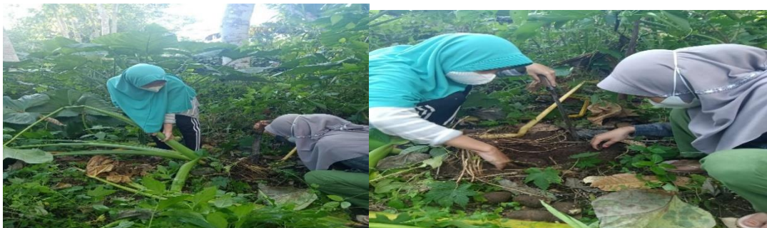
Gambar 5. Mengetahui Pangan Alternatif