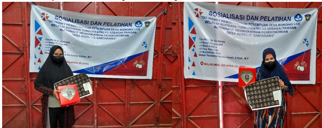
Gambar 10. Ibu PKK Mandiri dalam Pengolahan Pangan Alternatif