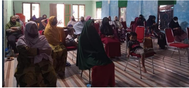
Gambar 3. Konsep Kelembagaan