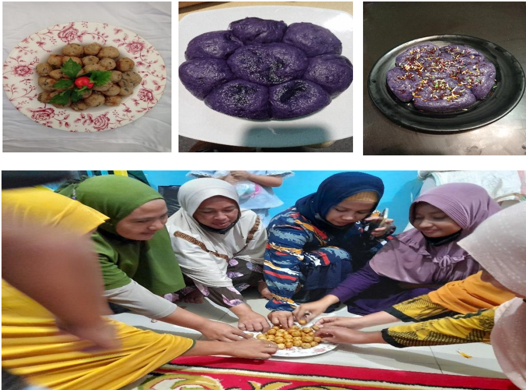
Gambar 9. Ibu PKK Mandiri dalam Pengolahan Pangan Alternatif