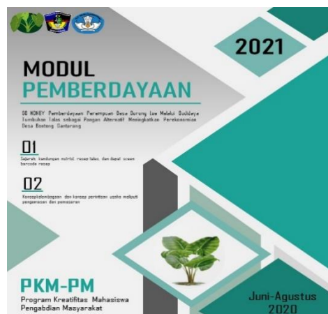
Gambar 2. Modul Pemberdayaan

Dalam modul pemberdayaan ini berisi tentang cara budidaya talas, penanaman pakan potensial dan cara penanamannya, cara pemanenan, konsep kelembagaan sedangkan konsep kelembagaan ini terdapat koordinator umum, koordinator penanaman, anggota dan job desk masing-masing dan Tim PKM-PM telah membuat konsep dalam jangka menengah dalam koordinasi setiap bidangnya dan yang terakhir konsep perintisan usaha meliputi pengemasan dan pemasaran.