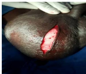
Figure 2. Cure d'hydrocèle après l'anesthésie locale

Les figures 2, 3 et 4 montrent quelques étapes de la cure d'hydrocèle.