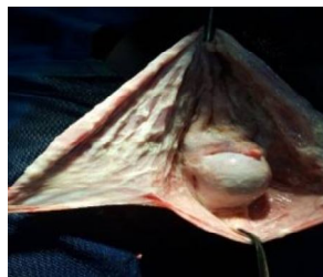
Figure 3. Cure d'hydrocèle. Exposition et résection de la vaginale