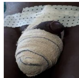
Figure 4. Cure d'hydrocèle. Fin de l'intervention

Incision au niveau du raphé médian. A noter l'enfouissement de la verge.